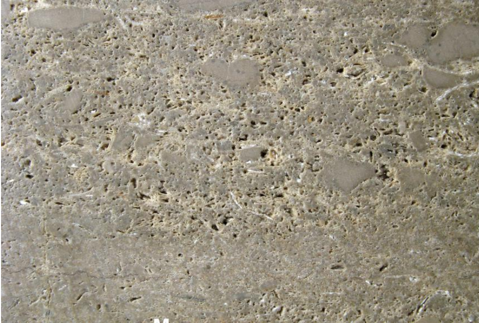
Handstück vom Döggingen-Oolith aus einem Profil in der Wutachschlucht

Der Döggingen-Oolith ist ein graugelber bis schmutzig-grüner, dickbankiger bis massiger, durch herausgelöste Ooide feinporöser, schwach dolomitischer Kalkstein, der durch Mergellagen in 1,2–2,4 m mächtige Bänke getrennt ist. In unterschiedlichem Umfang führt das Gestein Muschel- und Brachiopodenschill. Das Gefüge ist komponentengestützt. Aufgrund der leicht gelblichen Farbe wurde das Gestein mundartlich auch als „Elbenstein“ bezeichnet (Schalch, 1916; Metz, 1980; „elb, helvus, hochgelb, ... ein uraltes, heute nur noch unter schweizerischen und bairischen Hirten auftauchendes Wort, ... elbes schaf, elbe wolle“, Grimm & Grimm, 1854–1961). Westsüdwestlich des Ortsteils Münchingen der Gemeinde Stühlingen weisen die Gewannnamen „Elben“ und „Kalkofen“ auf den dort an mehreren Stellen ausstreichenden Döggingen-Oolith und seine Verwendung hin.