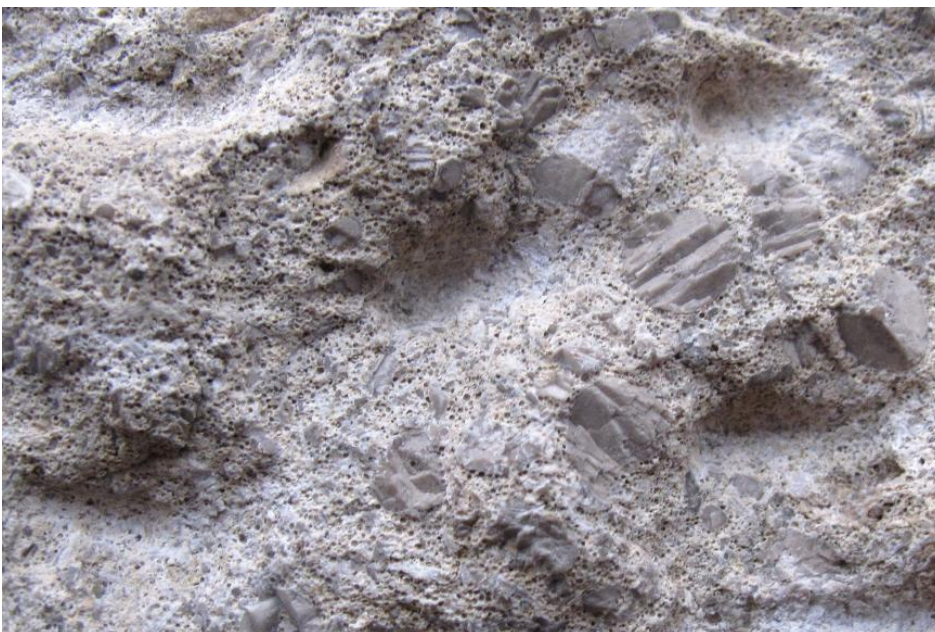
Katholische Stadtkirche in Bräunlingen: Detailaufnahme des großteils aus Marbach-Oolith bestehenden Bruchsteinmauerwerks

Marbach-Oolith: Im Gebiet Villingen–Schwenningen–Donaueschingen–Löffingen tritt im Trochitenkalk die durchschnittlich ca. 10 m mächtige Einheit des Marbach-Ooliths auf (Schalch, 1899, 1904, 1906, 1912; Paul, 1936, 1956). In zahlreichen kleinen Steinbrüchen wurden aus verschiedenen Niveaus dieser Abfolge Werksteine gewonnen. Der Gesteinsname geht auf den bereits in der ersten Hälfte des 19. Jh. intensiven Abbau dieses Kalksteins in mehreren Steinbrüchen an der Straße Marbach–Dürrheim zurück. Alberti (1834) beschrieb ihn von dort als „Rogenstein“. Einer der Marbacher Steinbrüche ist noch als Geotop gut zugänglich (RG 7916-300) (s. Weiterführende Links: LGRB-Kartenviewer – Geotope). Die Werksteinbänke waren max. 3 m mächtig, ihre nutzbare Mächtigkeit wechselte aber schnell, und ihre laterale Erstreckung war gering (Schalch, 1899).