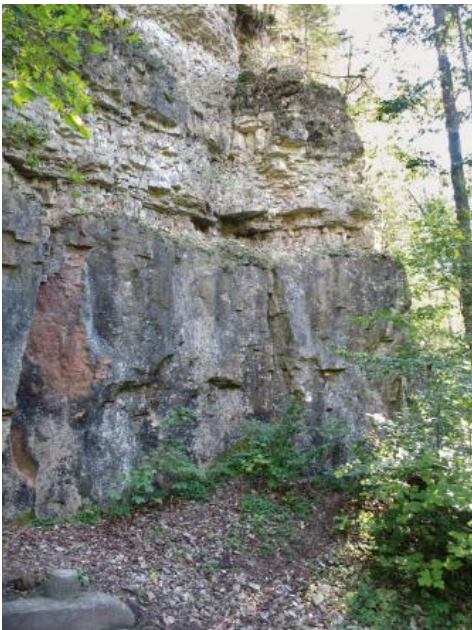
Döggingen-Oolith in einem Aufschluss bei der Wutachmühle

Der Döggingen-Oolith ist ein graugelber bis schmutzig-grüner, dickbankiger bis massiger, durch herausgelöste Ooide feinporöser, schwach dolomitischer Kalkstein, der durch Mergellagen in 1,2–2,4 m mächtige Bänke getrennt ist. In unterschiedlichem Umfang führt das Gestein Muschel- und Brachiopodenschill. Das Gefüge ist komponentengestützt. Aufgrund der leicht gelblichen Farbe wurde das Gestein mundartlich auch als „Elbenstein“ bezeichnet (Schalch, 1916; Metz, 1980; „elb, helvus, hochgelb, ... ein uraltes, heute nur noch unter schweizerischen und bairischen Hirten auftauchendes Wort, ... elbes schaf, elbe wolle“, Grimm & Grimm, 1854–1961). Westsüdwestlich des Ortsteils Münchingen der Gemeinde Stühlingen weisen die Gewannnamen „Elben“ und „Kalkofen“ auf den dort an mehreren Stellen ausstreichenden Döggingen-Oolith und seine Verwendung hin.