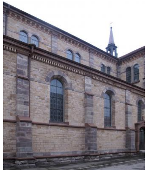
Katholische Stadtkirche in Bräunlingen: Das gelblich graue Bruchsteinmauerwerk besteht aus Marbach-Oolith

Ein prägnantes Beispiel für die Verwendung des Marbach-Ooliths als Baustein ist die 1881–1889 errichtete Pfarrkirche in Bräunlingen (s. rechte Spalte: Baugeschichte der Pfarrkirche Bräunlingen). In einer Informationsbroschüre des Pfarrgemeinderats zur Baugeschichte ist präzise die Herkunft des Baumaterials dokumentiert: „Die Kalksteine der Außenmauern, vom Sockel bis zum Turmgesims, stammen alle vom Steinbruch auf der Guldenen. Die Quadersteine am Sockel, den Gesimsfriesen und Fensterbögen, stammen von dem Buntsandstein im Gemeindewald Geführt. Dagegen wurden die äußeren Steinhauerarbeiten an den Portalen, Tür- und Fenstergestelle und Sockelgurt aus Fischbacher Sandstein, im Inneren aber die Gurten, Kapitäle und die Bodenbeläge aus Rohrschacher Sandstein hergestellt. Die sechs Granitsäulen, mit einer Höhe von 6,30 m, bestehen aus geschliffenem Granit aus Schonach.“