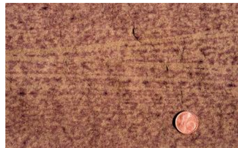
Rot gefleckte Varietät des Weiler Schilfsandsteins

Es handelt es sich beim Weiler Schilfsandstein um einen gleich- und feinkörnigen, meist tonig, z. T. auch kieselig und ferritisch gebundenen Feinsandstein; die Korngröße schwankt zwischen 0,07 und 0,15 \text{ mm} . Quarzanwachssäume (Kontaktzemente) um die Körner führen lokal zu einer recht hohen Festigkeit (s. u.). Als Porenzement wurde durch Dünnschliffuntersuchungen Serizit und Glaukonit sowie Limonit festgestellt (LGRB-Archiv, Bericht 1981). Karbonate oder Sulfate fehlen. Der feine Porenraum ist meist gut vernetzt, was zu hoher kapillarer Saugfähigkeit führt. Zugleich besteht aber nur geringe Gefährdung durch Frostsprengung, weil sich Wasser in den vernetzten Poren ausdehnen kann.