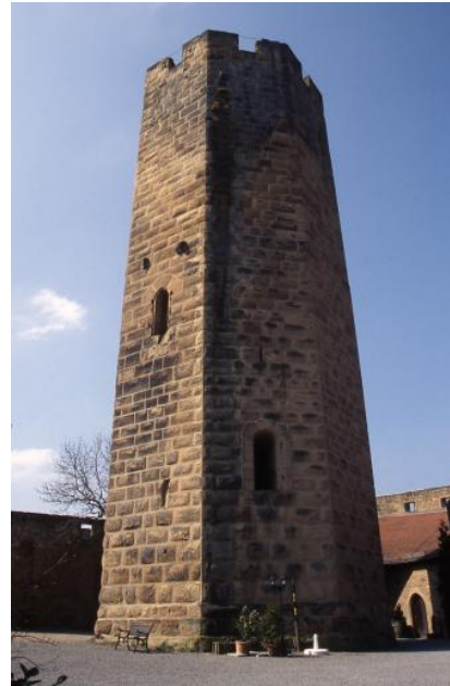
Stauferburg Steinsberg mit dem berühmten achteckigen Bergfried aus Weiler Sandstein

Wie in den anderen Schilfsandsteinbrüchen lag die frühere Hauptverwendung in der Produktion von Mauersteinen und Platten. Die Stauferburg Steinsberg bei Weiler, erstmals im Jahr 1109 erwähnt und seit 1973 im Eigentum der Stadt Sinsheim, wurde vollständig aus gelbem Weiler Schilfsandstein auf einem rund 60 Mio. Jahre alten Vulkanschlot aus Nephelinbasalt errichtet (s. weiterführende Links). Um 1436 wurde die Burganlage fertiggestellt. Der mächtige, aus Buckelquadern errichtete, achteckige Bergfried von 1235–1240 stellt eine Besonderheit unter den europäischen Burgen dar – vergleichbar mit Castel del Monte in Apulien. Eine große Zahl von Häusern und Kirchen, wie die 1861 in Waldangelloch erbaute ev. Kirche, sind aus Weiler Sandstein. Teile der Stiftskirche in Herrenberg bestehen ebenfalls aus diesem Sandstein (Lukas, 1990b). In den Jahren 1888/89 entstand Mannheims Wahrzeichen, der in der Architektur des Historismus im sog. römischen Monumentalstil errichtete große Wasserturm aus bräunlich gelbem Weiler und Heilbronner Sandstein.