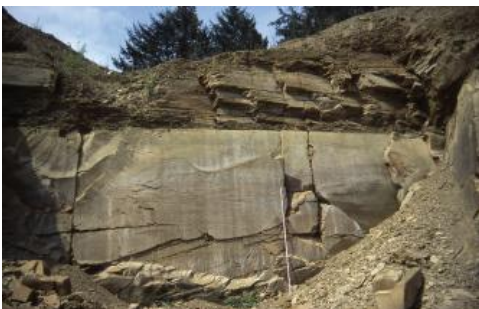
Schilfsandsteinbruch Hälde bei Sinsheim-Weiler, Nordwestwand

Der Steinbruch am Nordrand von Weiler im Gewinn Hälde (RG 6719-1) ist schon seit dem 12. Jh. bekannt. Die Gewinnung erfolgte in diesem Steinbruch in den 1980/90er Jahren durch Bohren und Sprengen bzw. Bohren und Keilen. Die Werksteinblöcke wurden nach engstündigem Bohren durch sog. Spaltsprengen mit der Sprengschnur gelöst (LGRB-Archiv). Anfang der 1990er Jahre wurde der Abbau wegen der damals auftretenden, o. g. Probleme mit Rissbildungen stark zurückgefahren; 1996 ging die Fa. Abele in die Fa. A. u. R. Naturstein-Aufbereitungs-GmbH über (Abele & Reimold, Gesteins- und Bauschuttrecycling). Seit 2018 wird der Steinbruch von der Fa. Stonebraker GmbH & Co. KG betrieben. Der alte Steinbruch an der Waldangelocher Straße (RG 6719-2) wurde einst von der Fa. Heller betrieben, in den 1970er Jahren stillgelegt und ab 1992 von der