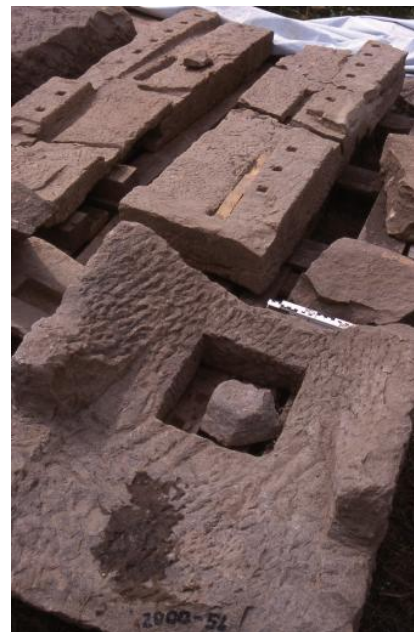
Spätantike Kellerfenster und Fensterbänke aus Pfaffenhofener Sandstein