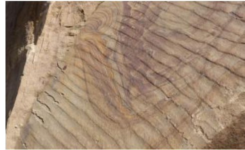
Strömungsrippeln auf einer Schichtfläche des Pfaffenhofener Schilfsandsteins

Charakteristisch ist das Auftreten von Limonitanreicherungen in Bändern, Schlieren oder in wolkiger Form (s. Sägefläche Pfaffenhofener Sandstein); diese Varietät wurde von der Fa. A. Burrer als „Kosak-Sandstein“ bezeichnet. Lagenweise treten Anreicherungen auch von größeren Schachtelhalmresten mit Stengelbreiten bis 10 cm auf. Wie in Maulbronn handelt es sich um einen fein- bis mittelkörnigen Arkosesandstein. Die Kornbindung ist überwiegend tonig-ferritisch, z. T. erfolgt sie über Anwachssäume aus Quarz. Dunkelbraune Lagen sind oft eisenkarbonatisch gebunden. Im Steinbruch am Hundbühl (RG 6919-3) waren noch 1988 unter 0,9 m Lösslehm 7 m plattige Sandsteine und darunter eine 5 m mächtige, dickbankige Werksteinzone aufgeschlossen. Die Sandsteine zeigen Farbvariationen von Grünlichgelb im Liegenden, über Gelbbraun bis Rotbraun im Hangenden.