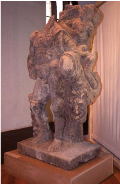
Spätantike Herkules-Statue im Römermuseum Güglingen aus Pfaffenhofener Sandstein