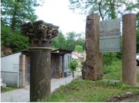
Zufahrt zum Werk der Fa. Melchior im alten Freudentaler Steinbruch

An der Straße von Freudental nach Bönningheim, kurz vor der Zufahrt zum Werksgelände der Fa. Melchior, ist die Erosionsdiskordanz zwischen dem Schilfsandstein und den liegenden dunkelgrauen Estherienschiefern gut aufgeschlossen. Nach LGRB-Berichten war noch 1988 im Steinbruch ein fast 10 m umfassendes Profil aufgeschlossen: Unter 0,5 m Boden und Hangschutt traten zunächst 2,5–3 m mächtige, plattige Sandsteine auf. Darunter folgten eine obere Werksteinbank mit 2,3 m und eine untere mit fast 5 m Mächtigkeit. Die Bänke fallen mit 3–5° nach Südwesten ein. Mehrere Meter weite Kluftabstände von senkrecht zueinander orientierten Hauptkluftsystemen (80/75° NNW, 170/55° WSW) ermöglichten die Gewinnung großer Rohblöcke. Um 1995 wurden kleinere Blöcke aus einer Bank mit einer Mächtigkeit von 2,5–3 m unterhalb der Plattenzone abgebaut. Aufgrund der Tatsache, dass auf dem Plateau nördlich von