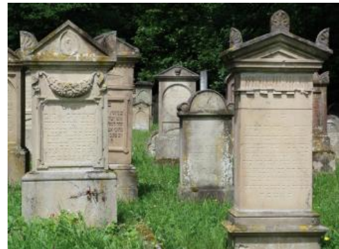
Grabsteine aus Freudentaler Sandstein, jüdischer Friedhof bei Freudental

Das Gestein eignet sich gut für Bildhauerarbeiten und die Produktion von Fassadenplatten. Aufgrund der makroskopischen Beschaffenheit und der bisherigen Verwendung an den Gebäuden der Umgebung ist davon auszugehen, dass der Freudentaler Sandstein in seinen Eigenschaften dem Schilfsandstein von Güglingen-Pfaffenhofen und dem von Heilbronn weitgehend entspricht, zumal der Michaelsberg-Strang, in dem die Vorkommen bei Freudental liegen, die westliche Fortsetzung des Heilbronner Stranges – unterbrochen durch die Erosionskerbe des Neckartals – darstellen.