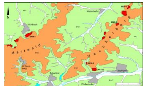
Geologische Übersichtskarte für das Gebiet von Hartwald und Heuchelberg

Das Schilfsandsteinvorkommen von Freudental liegt am Ostrand des in West–Ost-Richtung gestreckten Bergrückens des zuoberst aus Stubensandstein aufgebauten Strombergs, geologisch betrachtet somit am Ostrand der gleichnamigen geologischen Mulde. Am westlichen Rand dieser weitspannigen Muldenstruktur befinden sich die Steinbruchgebiete bei Maulbronn, Freudenstein und Schmie, am Nordrand das von Mühlbach. Im Zabertal, das sich von Osten her in die Muldenstruktur Stromberg–Heuchelberg einschneidet und den Stromberg im Norden begrenzt, liegen die Brüche von Güglingen-Pfaffenhofen.