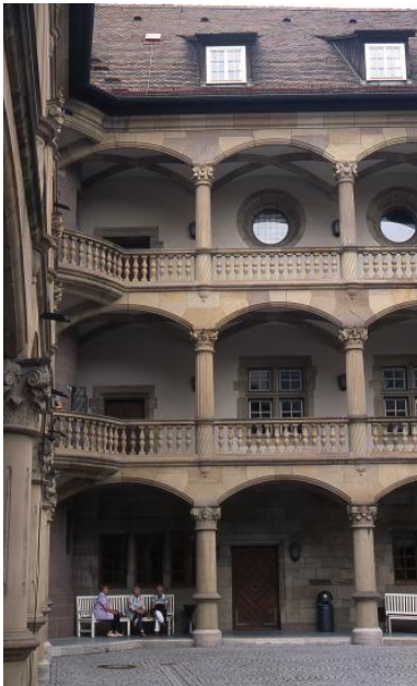
Altes Schloss in Stuttgart

Wie eingangs berichtet, wurde der Freudentaler Sandstein für Schloss, Synagoge und Profanbauten in Freudental verwendet; das schönste Beispiel bietet der zweite jüdische Friedhof außerhalb des Ortes mit den zahlreichen, oft fein ornamentierten Grabsteinen aus Sandstein. Otto Wölbart (Landesamt f. Denkmalpflege, Esslingen) berichtet, dass die Fa. Arthur Gräf zahlreiche großformatige Werkstücke für den Wiederaufbau des Alten Schlosses in Stuttgart geliefert hat. Nach Angaben der Fa. Melchior wurde der Freudentaler außerdem z. B. an folgenden Bauwerken im Rahmen von großen Renovierungsprojekten verwendet: Seeschloss Monrepos in Ludwigsburg, Musikhalle Ludwigsburg (Schmuckelemente und Mauerquader), Ritterstiftskirche in Bad Wimpfen im Tal, Stadtkirche in Vaihingen a. d. Enz, Schiff der Johanniskirche in Weinsberg und Friedenskirche in Ludwigsburg.