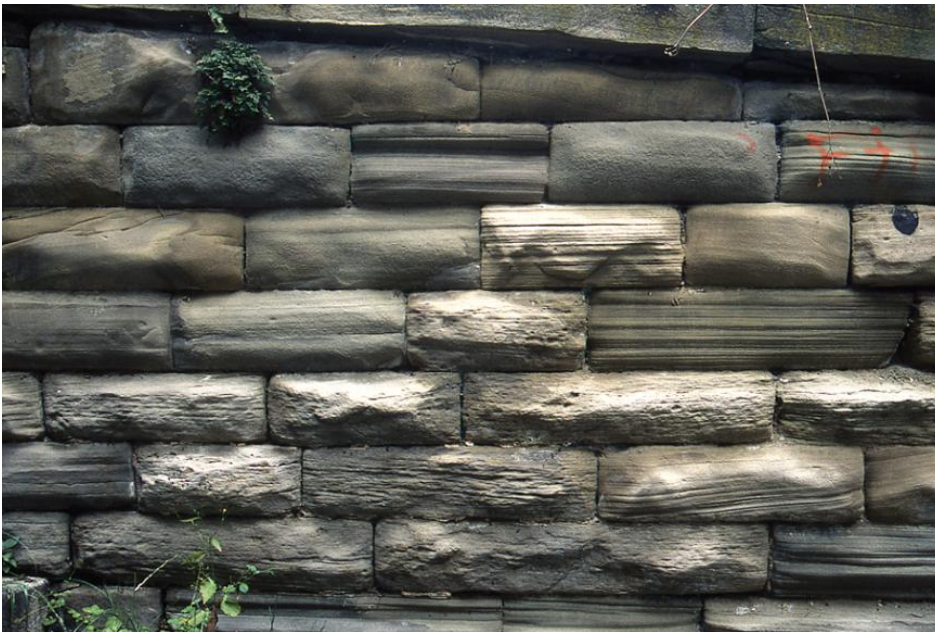
Treppenmauer an der Karlshöhe aus Stuttgarter Schilfsandstein

Die Sandsteine der Abbaugelände bei Stuttgart und bei Winnenden werden nachfolgend getrennt behandelt. Für das Stuttgarter Gebiet hat die Beschreibung eher dokumentarischen Hintergrund; bei Winnenden könnten hingegen noch Steinbrüche, z. B. zu Zwecken der Denkmalpflege, wieder in Betrieb genommen werden, weshalb Angaben zu den Eigenschaften der Sandsteine dieses Gebiets auch für künftige Projekte von Interesse sein können.