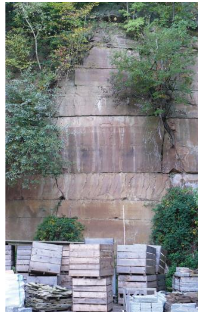
Dickbankiger, bräunlich gelber, oft rötlich geflammter Schilfsandstein im Steinbruch Baach

Gebiet Winnenden: In diesem Gebiet weisen die um 10 m mächtigen Werksteinvorkommen Bankmächtigkeiten von 0,5–2 m auf. In der Mehrzahl handelt es sich um gelbliche, rötlich geflammte, grünlich gelbe und graugrüne, tonig und tonig-ferritisch gebundene Quarzsandsteine mit geringem Karbonatgehalt (Dolomit, Kalzit). Örtlich treten kräftig rote „Blutsandsteine“ auf, so z. B. im Stbr. Winnenden-Hertmannsweiler (RG 7022-140) westlich von Allmersbach. Die Bänke sind oft durch feinstreifige bis flaserige, tonige Abschnitte getrennt, Schichtflächen enthalten feinste Hellglimmerschüppchen. Bei Schelmernholz treten auch warmgelbe Feinsandsteine auf, die eine rötliche Fleckung aufweisen und daher – wie in Renfrizhausen – als „Forellensandstein“ bezeichnet wurden. Die chemische Untersuchung von Sandsteinproben aus dem Stbr. Hertmannsweiler östlich von Nellmersbach erbrachte an Hauptbestandteilen: