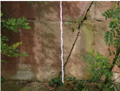
Roter Schilfsandstein im auflässigen Steinbruch bei Winnenden-Hertmannsweiler

Im Raum Winnenden wurde Schilfsandstein in den 1940er Jahren noch in geringem Umfang in Steinbrüchen mit 6–13 m nutzbarer Mächtigkeit gewonnen. So betrieb die Fa. A. Nägele im Gewinn Jammeracker bei Korb um 1947 noch einen Steinbruch am Waldrand oberhalb der Weinberge und erzeugte Bau- und Werksteine. Als nutzbare Mächtigkeit werden 16–20 m Sandstein bei 10–14 m überlagerndem Abraum angegeben. Der Schilfsandstein wurde für den Bau von Häusern und Kirchen, Gewölbekellern, Treppen und Mauern in den zu den Brüchen benachbarten Ortschaften verwendet. Wegen der häufig plattigen Aufwitterung der Schilfsandsteine aus dem Gebiet Winnenden haben die Vorkommen keine überregionale Bedeutung erlangt.