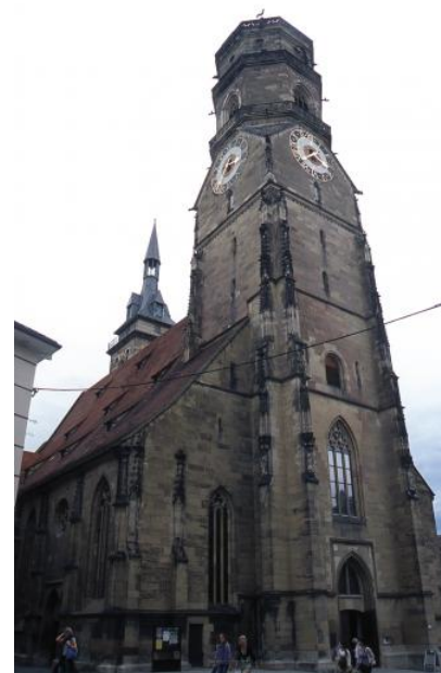
Die gotische Stiftskirche in Stuttgart aus Stuttgarter Schilfsandstein

Auch die ehemalige Stadtmauer war aus Stuttgarter Schilfsandstein errichtet worden (Reiff & Wurm, 1998). Die Staatstheater sind hingegen z. B. aus Maulbronner Schilfsandstein erstellt worden. Zu Beginn des 20. Jh. lieferten die Feuerbacher Steinbrüche Kellersteine, daneben Sockel- und Mauersteine (Reyer, 1927). Wegen seiner überwiegend tonigen Bindung und seinen lagenweise erhöhten Tonmineralgehalten eignet sich der Stuttgarter Werkstein aber nur eingeschränkt als Sockelstein, weshalb er seit den 1940er Jahren durch Granit- oder Trochitenkalksockel ersetzt wurde (Frank, 1950). Auch an häufig feuchten Stützmauern sandete er bald ab. Wo der Stuttgarter Schilfsandstein aber nicht starker bzw. andauernder Durchfeuchtung ausgesetzt ist, bleibt er über viele Jahrhunderte stabil, wie die historischen Gebäude der Stadt belegen.