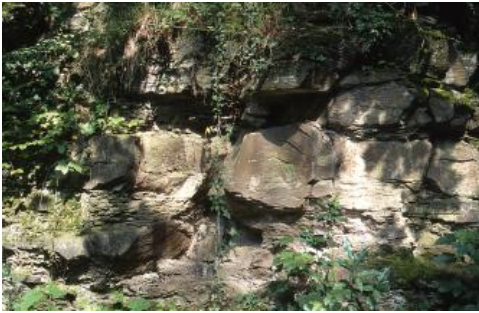
Obere aufgewitterte Bänke im alten Steinbruch auf der Karlshöhe, Stuttgart

Anhand der im Stuttgarter Stadtarchiv verfügbaren Steinbruchakten erstellte Bader (1940) eine Übersicht über die historische und zu Beginn des 20. Jh. noch stattfindende Nutzung der Gesteinsrohstoffe in und um Stuttgart. Die Gewinnung von Schilfsandstein zu Bauzwecken beginnt wahrscheinlich im 13. Jh. in den Steinbrüchen am Sonnenberg im Stuttgarter Osten und zwar im Bereich der noch heute „Steingrübenweg“ genannten Straße sowie an der Reinsburg (heute: „Karlshöhe“). Von hier kamen die Steine für die ältesten Teile der Stiftskirche und für den Bau des Alten Schlosses. (Nach Information von Otto Wölbert, LAD Esslingen, stammt das nach dem Zweiten Weltkrieg für den Wiederaufbau des Alten Schlosses verwendete Schilfsandsteinmaterial vor allem aus den Brüchen bei Freudental (früher Fa. Gräf) und bei Sinsheim-Weiler (Fa. Abele). Zahl und Größe