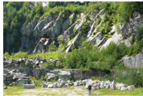
Bühlertal-Granit aus dem Steinbruch Rotenberg, östlich Bühlertal

Im Steinbruch Rotenberg (Steinbruch-Nr.: RG 7315-1) ist der Bühlertal-Granit in einer Mächtigkeit von 60–70 m aufgeschlossen. Charakteristisch ist eine deutliche Klüftung mit glatten Trennflächen. Die Klüfte weisen die Hauptrichtungen N–S, NW–SO und OSO–WNW auf und fallen mit 50–80° ein. Aufgrund dieses polygonalen Kluftsystems war es früher ausreichend, das Gestein mit horizontalen Sprengbohrungen zu lösen. Der so an seiner Basis gelockerte Granitblock glitt dann entlang der flach einfallenden Klüfte auf die Abbausohlen. Die Größe der dabei entstehenden Rohblöcke war abhängig vom Kluftabstand. In einigen Bereichen des Steinbruchs können die Trennflächen einen Abstand bis zu 4 m aufweisen. Aus Sicherheitsgründen wird diese Abbaumethode nicht mehr durchgeführt. In den letzten Jahren wurde auf zwei jeweils 4 m hohen Sohlen das Gestein mit Hilfe von vertikalen und horizontalen Spaltbohrlochsprengungen gewonnen. Seit 2016 ruht der Abbau. Bis dahin wurden nur ca. 15 % des gelösten Materials als Naturwerkstein weiterverarbeitet, das restliche Material fand Verwendung im Verkehrswege- und Landschaftsbau.