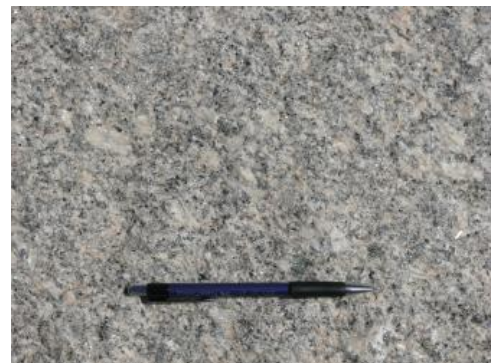
Raumünzach-Granit mit Kalifeldspateinsprenglingen aus Forbach-Raumünzach

Weißliche bis rötliche, idiomorphe bis hypidiomorphe Kalifeldspatkristalle, die als Einsprenglinge vorliegen, können eine Kantenlänge von bis zu 5 cm erreichen und führen zu einem leicht porphyrischen Aussehen des Granits. Partienweise zeigen die Feldspateinsprenglinge eine Einregelung. Quarz (im Mittel 25 Vol.-%) bildet farblose, transparente und xenomorphe Kristalle. Hellgraue bis weißliche, hypidiomorphe Plagioklase (hauptsächlich Oligoklas) sind mit ca. 20 Vol.-% an der Granitzusammensetzung beteiligt. Die Glimmer machen 10 Vol.-% des Gesteins aus und setzen sich aus schwarzem Biotit und silberweiß glänzendem Muskovit zusammen. Der Biotitanteil beeinflusst stark die Farbgebung des Granits. Biotitreiche Partien wirken grau und dunkel, biotitarme dagegen lassen das Gestein weißlich bis weiß mit schwarzen Sprengeln aussehen. Stellenweise treten dunkle, biotitreiche Schlieren im hellen Granit auf. Neben dem fein verteilten Biotit kann das Mineral auch in Nestern konzentriert vorkommen, die im Allgemeinen einen Durchmesser von 2 cm aufweisen, aber auch mehrere Meter im Durchmesser erreichen können.