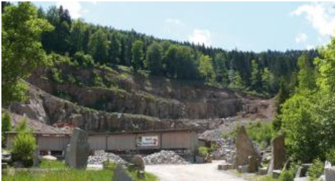
Murgschifferschaftsbruch der Fa. VSG Schwarzwald-Granit-Werke

Zurzeit (Stand 2021) wird der Forbach-Granit und Raumünzach-Granit überwiegend im Murgschifferschaftsbruch (RG 7316-3) sowie gelegentlich im benachbarten Gemeindebruch (RG 7316-2) der VSG in Raumünzach im Murgtal, südlich von Forbach, gewonnen. Von Bedeutung ist hier aktuell die Möglichkeit, neben der Erzeugung von Werksteinwaren auch Wasserbausteine und Mauersteine aus Granit produzieren zu können, da aufgrund der niedrigen Preise für Granitwerksteine – ausgelöst durch den umfangreichen Import besonders aus China und Indien – derzeit die Erzeugung von Produkten für den „GaLa-Bau“ im Vordergrund steht; hierzu bietet sich die Mitverwendung der oberflächennah aufgelockerten Bereiche und