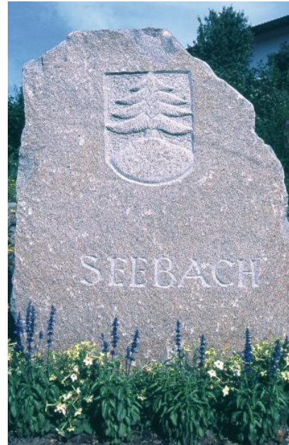
Granitstele aus Seebach-Granit am Ortseingang von Seebach

Aus dem Seebach-Granit können Groß-, Klein- und Mosaikpflastersteine, Bord- und Randsteine, rechteckige Mauersteine, Treppenstufen, Fassadenplatten, Flussbausteine mit 20–30 cm Kantenlänge, Vermessungssteine und Steine für sog. Zyklopenmauerwerke erzeugt werden. Gängige Pflastersteingrößen sind (jeweils kleinste und größte zulässige Kantenlänge): 4–6 cm, 5–7 cm, 7–9 cm, 8–10 cm, 10–12 cm und 15–17 cm. Bisweilen werden auch Säulen, Denk- und Grabmale oder Stelen hergestellt. Die Steinfiguren sowie die Treppe und der Sockel des Bunsen-Denkmal in Heidelberg wurden aus Seebach-Granit erstellt. Ende der 1990er Jahre wurde Seebach-Granit zur Ausgestaltung der Deutschen Botschaft in Peking (China) eingesetzt (Regelmann et al., 2002). In den letzten Jahren wurden von der Fa. Fischer-Granit Pflaster und Gestaltungssteine für Garten- bzw. Parkanlagen und Spielplätze nach Basel, Koblenz (Bundesgartenschau) und auf die Insel Mainau geliefert.