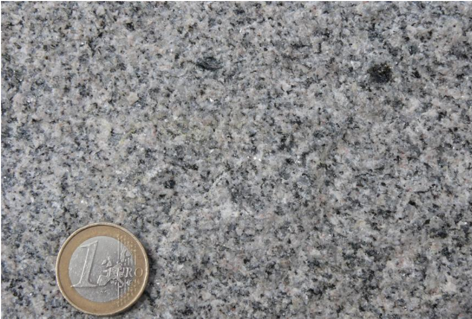
Seebach-Granit: Steinbruch Seebach

Die Kristalle der Hauptgemengteile sind meist hypidiomorph ausgebildet. Nur die Quarzkörner sind xenomorph. Die durchschnittliche Korngröße liegt zwischen 1 und 4 mm. Selten treten porphyrische Bereiche auf, die Kalifeldspatkristalle mit ca. 1–2 cm Länge aufweisen. Häufiger kommen dagegen Nester aus Biotit mit ca. 2 cm Durchmesser vor. Von Klüften ausgehend wurden im oberflächennahen Bereich Liesegang'sche Ringe aus Eisenhydroxiden gebildet, die mehrere Meter weit ins Gestein reichen können. In den Steinbrüchen bei Seebach tritt überwiegend ein sehr fester, harter, gleichkörniger Granit auf, der aufgrund dieser Eigenschaften ein weites Einsatzspektrum aufweist (s. u.). In engständiggeklüfteten Abschnitten entstand im Einfluss der Verwitterung ein bräunlich grauer, beim Anschlagen dumpf klingender Granit, der deutlich weniger Festigkeit aufweist und nicht als Werkstein- oder zur Erzeugung von Körnungen verwendet werden kann.