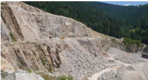
Steinbruch der Fa. Fischer Granit im Seebach-Granit

Die Kristalle der Hauptgemengteile sind meist hypidiomorph ausgebildet. Nur die Quarzkörner sind xenomorph. Die durchschnittliche Korngröße liegt zwischen 1 und 4 mm. Selten treten porphyrische Bereiche auf, die Kalifeldspatkristalle mit ca. 1–2 cm Länge aufweisen. Häufiger kommen dagegen Nester aus Biotit mit ca. 2 cm Durchmesser vor. Von Klüften ausgehend wurden im oberflächennahen Bereich Liesegang'sche Ringe aus Eisenhydroxiden gebildet, die mehrere Meter weit ins Gestein reichen können. In den Steinbrüchen bei Seebach tritt überwiegend ein sehr fester, harter, gleichkörniger Granit auf, der aufgrund dieser Eigenschaften ein weites Einsatzspektrum aufweist (s. u.). In engständiggeklüfteten Abschnitten entstand im Einfluss der Verwitterung ein bräunlich grauer, beim Anschlagen dumpf klingender Granit, der deutlich weniger Festigkeit aufweist und nicht als Werkstein- oder zur Erzeugung von Körnungen verwendet werden kann.