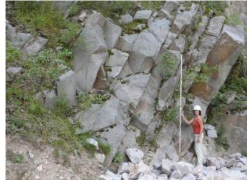
Geklüfteter Granit im Steinbruch der Fa. Fischer-Granit

Die Hauptklufsysteme streichen, wie oben erwähnt, in N–S- und O–W-Richtung, daneben existiert noch ein untergeordnetes Klufsystem, das mit ca. 30° nach WSW einfällt. Die Klufabstände reichen von 0,2–0,5 m bis 1,5 m. Daraus resultieren maximale Blockgrößen um 3–4 m 3 . Aufgrund seiner hohen Druckfestigkeit, die auf das gut verzahnte, gleichkörnige Gefüge zurückzuführen ist, wurde der Seebach-Granit früher hauptsächlich zur Herstellung von Pflaster- und Mauersteinen verwendet. Seit 2010 ist man auf diese Anwendungsmöglichkeit – neben der Erzeugung von Edelsplitten usw. – wieder zurückgekommen. Prüfzeugnisse der oben genannten Firmen von 1986, 2008, 2009, 2010, von Regelmann (2002) (R) sowie aus der Internationalen Naturwerkstein-Kartei (INSK, Müller, 1984ff) geben folgende gesteinsphysikalische Daten für den Seebach-Granit an: