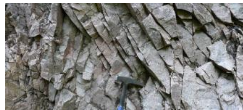
Gesteine des Triberg-Granits im Steinbruch Elzach-Yach

Folgende Richtungen steil stehender Klüfte sind häufig: NW–SO, NO–SW, NNW–SSO und N–S. Insgesamt wurde ein Einfallen zwischen 60–80° beobachtet, zudem weist mindestens eine Kluft Richtung ein Einfallen von 40–50° auf. Darüber hinaus zeigen die meisten Trennflächen Beläge aus Hämatit bzw. Chlorit. Insgesamt ist das Gestein mit einer Vielzahl von Klüften und Rissen mit Alterationen durchzogen.