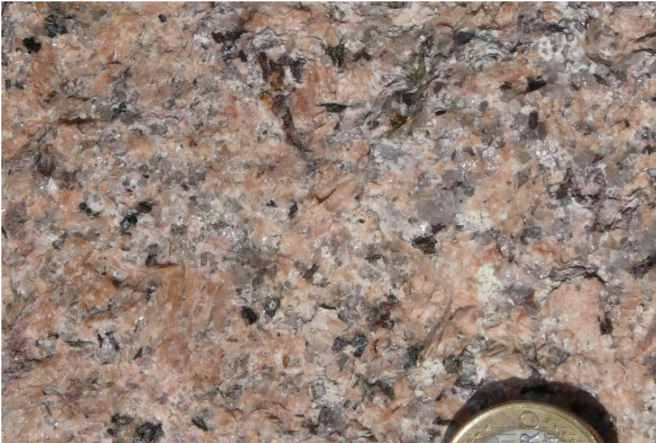
Mittel- bis grobkörniger Triberg-Granit