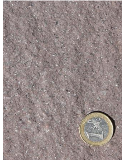
Feinkörniger Granitporphyr mit Quarz-, Feldspat- und Biotiteinsprenglingen

Der primäre Biotitgranit enthält aufgrund später Magmendifferentiation zahlreiche Einschaltungen von Zweiglimmergraniten und Granitporphyrgängen, weshalb er in den 1970er Jahren zum Ziel der Uranprospektionsfirmen wurde (Werner, 2006a). Außerdem hat dieses Granitmassiv zahlreiche bruchtektonische Vorgänge erlebt (Brekzien- und Ruschelzonen), die von hydrothermaler Aktivität begleitet waren. Dies führte zur lokalen Anreicherung von Uran, Wismut, Nickel, Kobalt und anderen Erzen. Aufgrund dieser Alterationsvorgänge sind große Bereiche dieses Granitmassivs nicht für eine Natursteinnutzung geeignet; diese sind durch Kartierung zu ermitteln.