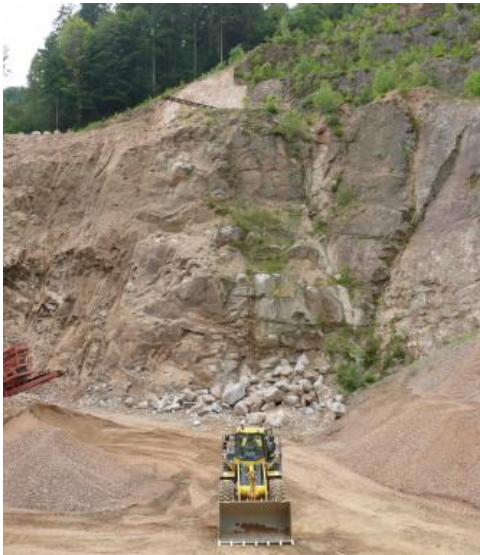
Tiefgründige Vergrusung, Steinbruch Tegernau-Niedertegernau

Die oberflächennahen Bereiche des Malsburg-Granits zeigen Vergrusung und Wollsackverwitterung. Die Verwitterungszone reicht von 1–2 m bis zu mehreren Zehnermetern tief. Der Steinbruch Tegernau-Niedertegernau (RG 8212-5) weist eine tiefgründige Wollsackverwitterung auf. Hierbei wittert der Granit entlang der Klüfte schalenförmig ab, wobei bis zu 5 Kubikmeter große, gerundete Blöcke und sandiger Granitgrus entstehen.