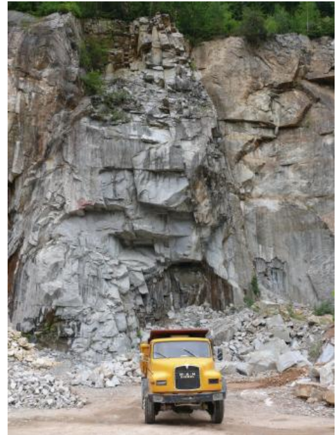
Malsburg-Granit im Steinbruch Malsburg-Marzell

Das Gestein besitzt ein orthogonales Kluftsystem, das bevorzugt NW–SO und NO–SW streicht und ein Einfallen von 70–85° aufweist. Nur im Steinbruch bei Lütchenbach (RG 8212-6) dominieren N–S- und O–W-Richtungen. Die Kluftabstände variieren zwischen Bereichen mit 2–5 und 1–2 Klüften pro Meter, wobei weit- und engständig geklüftete Bereiche in einem Abstand von 10–30 m abwechseln. Die größten Kluftabstände treten im Steinbruch Malsburg-Marzell und in Lütchenbach (RG 8212-3 und -6) mit einem Abstand von 1–2 m auf. Subhorizontale Klüfte (Lagerklüfte) weisen in der Regel einen Abstand von 1–2 m auf. Die maximale gewinnbare Rohblockgröße beträgt somit etwa 2 x 2 x 1 m. Auf den Kluftflächen treten nicht selten bis 5 mm dicke Beläge aus rotem Hämatit bzw. schwarzgrünlichem Chlorit auf.