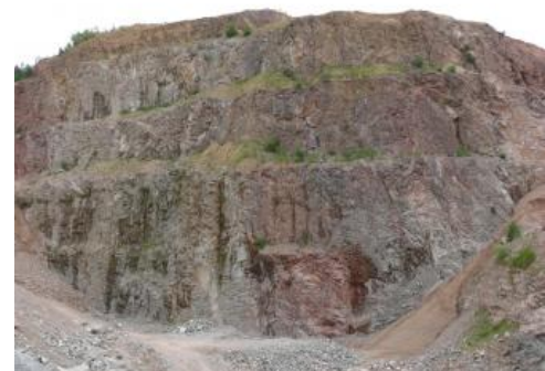
Abbau von Malsburg-Granit sowie eines Granitporphyrgangs, Steinbruch Tegernau

In den Steinbrüchen bei Malsburg-Marzell ist die graue Varietät des Malsburg-Granits mit weißem bzw. rosa Kalifeldspat aufgeschlossen (RG 8212-2 und -3): Dagegen werden die Varietäten in den Steinbrüchen Tegernau und Lütchenbach von rötlichem Kalifeldspat dominiert (RG 8212-1 und -6). Porphyrische Bereiche weisen 2–3 cm große Kalifeldspateinsprenglinge mit idiomorphen Formen auf. In gleichkörnigen Bereichen geht die Kristallgröße nicht über 1–4 mm hinaus, der Habitus der weißen Plagioklas-, Kalifeldspat- und schwarzen Biotitkristalle ist hypidiomorph bis idiomorph. Grauer Quarz liegt in xenomorpher Form vor. Stellenweise treten dunkle, bis 2 cm große Nester aus Biotit auf. Von Klüften ausgehend entstanden konzentrische Liesegang'sche Ringe aus Eisenhydroxiden.