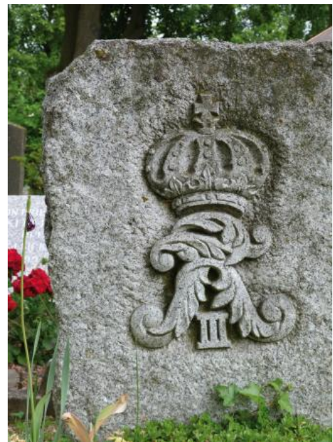
Grabstein aus Malsburg-Granit auf dem Friedhof in Müllheim

In den heute (Stand 2021) betriebenen Steinbrüchen im Malsburg-Granit wird das Gestein mittels Großbohrlochsprengungen aus seinem Verband gelöst und derzeit bevorzugt zu Wasserbausteinen, Straßen- und Gleisbaustoffen verarbeitet. Zudem werden Blöcke für den Garten- und Landschaftsbau verkauft, bisweilen zur Herstellung von Grabmalen. Großes Potenzial für die Gewinnung von Naturwerksteinen bieten die in den Steinbrüchen der Fa. Dörflinger in Malsburg-Marzell und in Lütchenbach (RG 8212-2 und -6) genutzten Granitkörper. Der Steinbruch Malsburg-Marzell (RG 8212-2) ist in Betrieb (Stand 2021), es wird die graue Granitvarietät gewonnen. Der Abbau der roten Varietät in Lütchenbach findet nicht mehr statt, der Betrieb ist seit 2013 stillgelegt. Potenzial besteht auch im Steinbruch der Fa. Seider in Malsburg-Marzell (RG 8212-3), wobei sich der Granit hier durch Bereiche mit weitständiger Klüftung auszeichnet. Durch Wollsackverwitterung entstandene Blöcke können in Tegernau-Niedertegernau (8212-5) bei der Fa. Vögtlin bezogen werden.