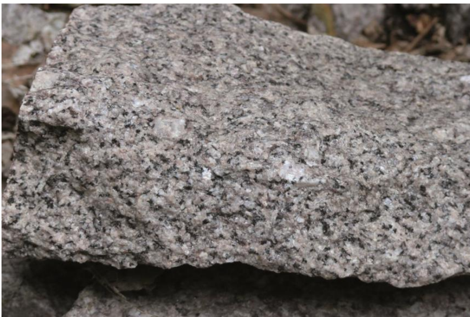
Heidelberg-Granit vom Wildeleutstein am Eichelberg

Blättchen. Mineralogisch setzt sich der Granit aus Orthoklas (Kalifeldspat): 35–37 Vol.-%; Plagioklas: 30 Vol.-%; Quarz: 20–27 Vol.-% und Biotit: 5–10 Vol.-% zusammen (LGRB, 2012a).