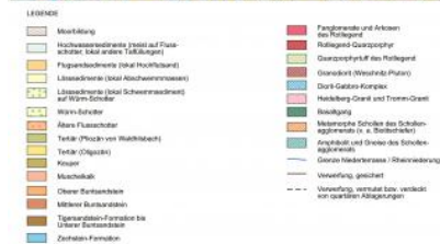
Geologische Karte des südlichen Odenwalds und angrenzender Regionen