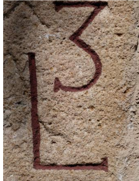
Block aus Stubensandstein an ehem. Mühlegebäude („Neckarburg“) bei Neckartenzlingen

Etwa 200 m südlich der Brüche wird das Lager schon von 8 m Abraum überdeckt. Die in ein 2 m mächtiges oberes und ein 1,5 m mächtiges unteres Lager getrennte Sandsteinschicht wird dort von etwa 2 m plattigen, tonigen Sandsteinen und von 2,7 m mächtigen siltig-sandigen Feinsedimenten der Vierten Hangendletten überlagert; darüber folgen die Tonmergelsteine der Knollenmergel-Formation. Einen Einblick in die stark wechselhafte Abfolge bieten die schluchtartigen Bachrisse im Waldgebiet östlich der Neckarburg. An den steinsichtigen Gebäuden an der Neckarburg ist der grobe Quarzsandstein aus den Altenrieter Brüchen erhalten.