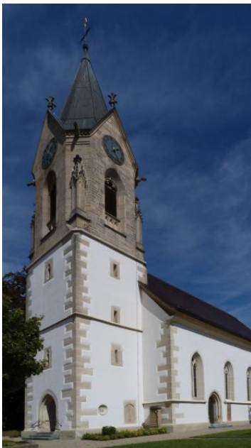
Kirche in Pliezhausen erbaut aus Stubensandstein

Fast vollständig aufgeschlossen war der ca. 6–7 m mächtige Dritte Stubensandstein im Bruch im Herbst 2011. Es ließen sich während des Abbaus im oberen, etwa 5 m mächtigen Lager zwei Werksteinbänke mit 2–2,2 und 2,5–3 m Dicke unterscheiden, die durch eine etwas unregelmäßige Lagerfuge getrennt werden. Darunter folgen plattige, tonigere Sandsteine von etwa 2 m Mächtigkeit, darunter die Zweiten Hangendletten, der als Wasserstauer fungiert. Steilstehende Klüfte durchziehen die Bänke in stark unterschiedlichem Abstand, z. T. in Abständen von wenigen dm, teilweise aber auch von mehr als 2,5 m. Über dem Abbauhorizont ist eine ca. 2 m mächtige Wechselfolge von Ton- und Schluffsteinen und eingeschalteten dm mächtigen Sandsteinbänken aufgeschlossen, die den Dritten Hangendletten zuzuordnen sind. Die Hangendletten sind typisch braunrot, z. T. violett und ockerbraun gefärbt. Der in mehrere, geringmächtige Bänke gegliederte Vierte Stubensandstein ist in diesem Steinbruch hingegen stark mürbe. Der Pliezhauser Sandstein ist an vielen Gebäuden der Umgebung anzutreffen, besonders gut ist er an der St. Martinskirche in Pliezhausen selbst zu studieren. Seine jüngste Verwendung fand er im Stuttgarter Innenministerium.