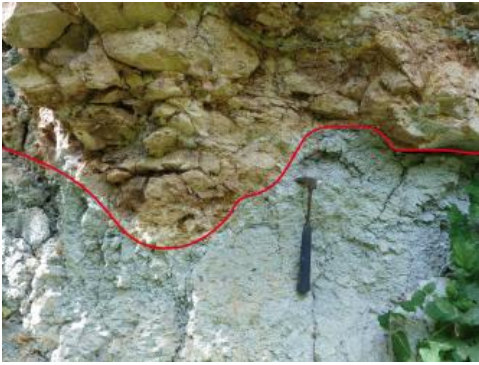
Erosionsdiskordanz zwischen Sandstein (oben) und Tonstein