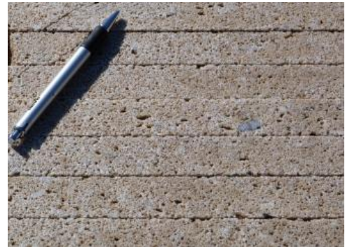
Grobkörniger, stark poröser Pliezhauser Stubensandstein

Das im Jahr 2013 im Stbr. Pliezhausen aufgeschlossene, insgesamt 5–7 m mächtige Sandsteinpaket besteht aus mehreren, z. T. durch Ton bzw. Mergel oder durch dünnplattige Sandsteine getrennte Lager von 0,3 bis 3 m Mächtigkeit. Die Lager weisen je nach Bindemittel und Kornverzahnung stark wechselnde Materialeigenschaften auf. Das genutzte Lager, der obere Teil des Dritten Stubensandsteins (vgl. Modell des Aufbaus der Oberen Stubensandstein-Schichten), besteht aus einem mittelsandigen, schwach feinkiesigem Grobsandstein und Fein- bis Mittelsandsteinen mit charakteristischer feiner Limonitsprenkelung. Die Bindung ist kaolinitisch-kieselig. Der Pliezhauser Stubensandstein sandet im Anbruch leicht ab, in der gesägten Oberfläche ist er grobporig und nicht absandend. Die Farbe ist fast weiß/grauweiß bis bräunlich beige, bisweilen leicht rötlich.