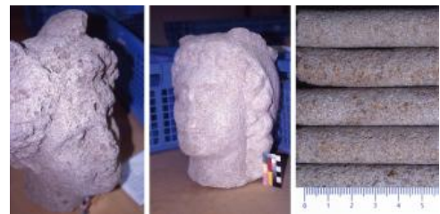
Zahlreiche Statuen aus Stubensandstein aus dem römischen Heiligtum von Eutingen-Rohrdorf

Aus dem genannten Gebiet wurde schon zu römischer Zeit Werksteinmaterial, vor allem für Repräsentativbauten, aber auch für Statuen, flussabwärts über den Neckar transportiert. Das grobkörnige, großporige Material war für die antike Bildhauertechnik, die eine vollständige Bemalung der Figuren einschloss, offensichtlich besonders gut geeignet (Werner in: Künzl, 2010). Sandstein vom Typus Pliezhausen–Altenriet wurde u. a. für die berühmten Zwölfgötterstatuen des Vicus von Rohrdorf verwendet.