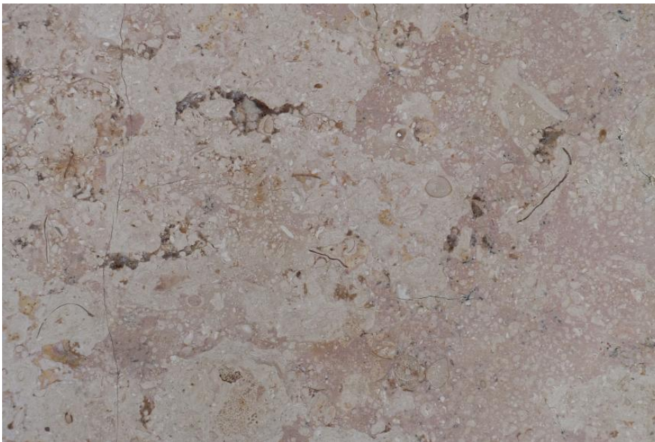
Platte des schwach rosa „Tuttlinger Marmors“, Steinbruch Eichen