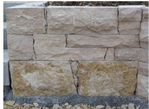
Gartenmauer aus Tuttlinger Marmor

Fortschreiten des Abbaus Richtung Süden die dickbankigen Bereiche auskeilten. In den dünnbankigeren Bereichen bestand keine ausreichende Frostsicherheit mehr; zusätzlich wurde seit 2005 durch die Umstellung im Abbau auf ein weniger schonendes Sprengverfahren die Gewinnung von frostbeständigen Wasserbau- und Mauersteinen unmöglich gemacht. Im Jahr 2009 installierte die Fa. Storz, Tuttlingen, eine neue Aufbereitungsanlage. In den Jahren 2010-2013 wurde der Betrieb zur Gewinnung von gebrochenem Material für den Verkehrswegebau aber auch von Werksteinmaterial wieder aufgenommen; der Abbau wendete sich nun in nördliche und westliche Richtung, auch wenn in diese Richtungen der Abraumanteil durch überlagernde zuckerkörnige Kalksteine deutlich zunimmt.