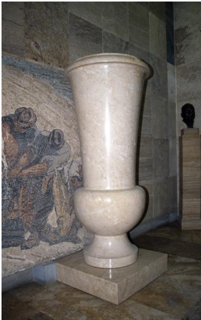
Bodenvase aus Elfenbeinmarmor

Aufgrund seiner eingeschränkten Frostbeständigkeit wurde der Kalkstein meist nur für Innenarbeiten verwendet. In den 1960/70er Jahren wurden viele große Geschäftshäuser und Postämter damit ausgekleidet, wie z. B. das Schuhhaus Schöpp und das Postamt 1 in Stuttgart sowie das Continentalgebäude und das Postamt in Hannover. Viele dieser Gebäude sind heute bereits abgerissen. Der Schopflocher „Elfenbeinmarmor“ diente außerdem als Außenwandverkleidung am Turm des neuen Stuttgarter Rathauses und ist in Gestalt brusthoher Vasen im Naturschutzzentrum Schopflocher Alb und im Verwaltungsgebäude der Fa. Lauster Steinbau zu bewundern.