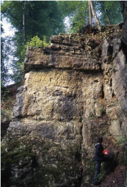
Ehemaliger Steinbruch Möhringen bei Tuttlingen

Im Bereich eines Donau-Umlaufberges östlich von Immendingen wurden im stratigraphischen Niveau der Liegende-Bankkalk-Formation (Oberer Oberjura) „Quaderkalk“ zum Bau der Bahnstrecke Immendingen–Singen gewonnen, z. B. bei Hattingen (RG 8018-341), von Spitz (1930b) auch als sogenannte „Hattinger Riffkalk“ bezeichnet (Hattingen-Trümmerkalk). Frank (1944) berichtet, dass bei Immendingen von der Fa. A. Lauster, Stuttgart, ein rötlicher, dichter, teilweise fossilreicher Kalkstein als Quader für Brückenpfeiler, Sockelgemäuer, Pflaster-, Grenz- und Marksteine, Randplatten, Straßen- und Bahnschotter abgebaut wird.