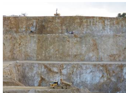
Gewinnung von oberjurassischen Kalksteinen der Korallenkalk- und der Nerineenkalk-Formationen

Der Bruch der Fa. HeidelbergCement bei Huttingen bietet ein gewisses Potenzial für die Gewinnung von Austauschmaterial für Renovierungsarbeiten, sofern Blöcke mittels Reißen, also nicht im Sprengbetrieb, gelöst werden. Die 70–80 m mächtigen, in Splitterkalke und Korallen- bzw. Rauracienkalke unterteilten, massigen bis undeutlich geschichteten Kalksteine sind in Folge der intensiven Oberrheingraben tektonik oft engständig geklüftet. Dennoch gibt es geschonte Bereiche, die attraktive, fossilreiche Massenkalke bieten können.