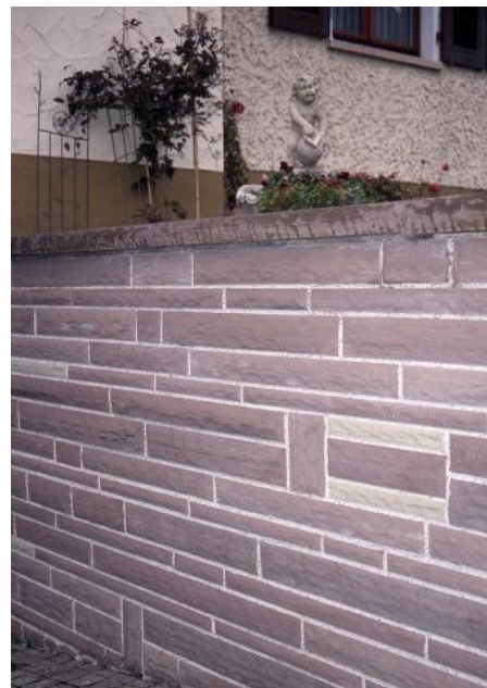
Neue Mauer aus Trichtinger Schilfsandstein, Ortszentrum Trichtingen