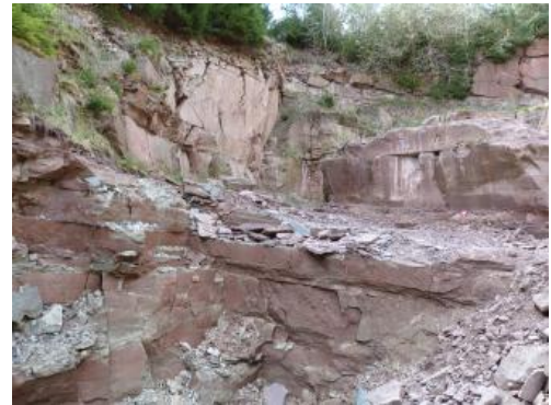
Steinbruch der Fa. Holzer bei Trichtingen nach frischer Gewinnungsarbeit

Im Stbr. Holzer (RG 7717-9) sind die Schichten schwach mit 3–10° nach Nordosten geneigt, auch söhliche Bereiche treten auf. Trotz der Position zwischen zwei Grabenstörungen ist die Durchklüftung überwiegend weitständig. Drei Kluftrichtungen (Streichen) herrschen vor: