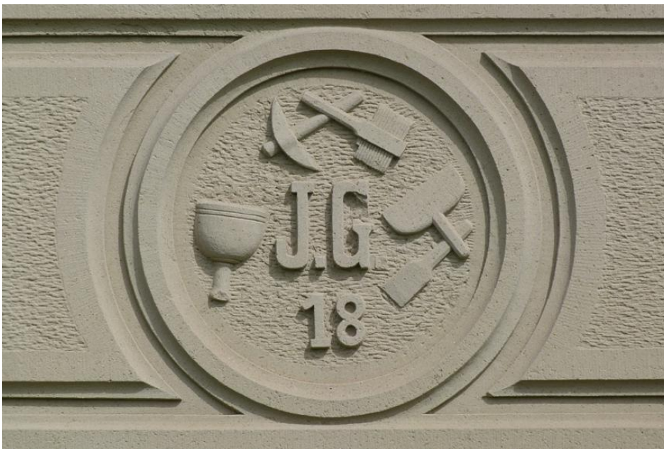
Schmuckstein an Haus in Epfendorf-Trichtingen aus Trichtinger Schilfsandstein

Rund 5 km östlich von Oberndorf am Neckar befindet sich der Ort Trichtingen, Gemeinde Epfendorf, im Landkreis Rottweil, der auf eine lange Steinhauertradition zurückblickt. Ein besonders schönes Verwendungsbeispiel für Trichtinger Sandstein (Mittelkeuper, Stuttgart-Formation) ist die Kirche in Altoberndorf. Nördlich des Ortes erhebt sich ein Höhenrücken mit zwei Geländestufen, die obere aus Schichten der Stubensandstein-Formation, die untere aus Schilfsandstein. Der geologische Bau dieses Gebietes ist durch einen nur etwa 300–400 m breiten, tektonischen Graben gekennzeichnet, der das Gebiet in NO–SW-Richtung durchzieht. Einige Werksteinbrüche liegen innerhalb des Grabens, der möglicherweise einen ehemals besonders tief eingekerbten Schilfsandsteinstrang nachzeichnet. Die Mächtigkeit des Sandsteins erreicht 20 m. In den meisten Steinbrüchen liegt die früher genutzte Mächtigkeit bei 8–10 m, so z. B. im großen alten Bruchgelände im Forchenwäldle.