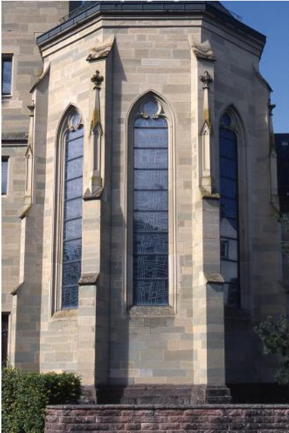
Altoberndorfer Kirche aus Trichtinger Sandstein