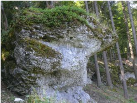
Felsen am Meßstetter Berg zwischen Ebingen und Meßstetten

Gewinnung: Die kleineren Steinbrüche und Seitenentnahmestellen wurden noch bis in die 1950/60er Jahre betrieben. Das Brechen des Gesteins und z. T. das Bohren der Sprenglöcher erfolgte vielfach noch von Hand, das gewonnene Gestein wurde anschließend weiter mit der Hand zerkleinert. Zeitweise kam ein fahrbarer Schotterbrecher zum Einsatz. An anderer Stelle wurde das Gestein mit dem Rollwagen zum Schotterwerk gebracht. Dort erfolgte die Aufbereitung mittels Brecher und Trommelsieb. Die verschiedenen Körnungen wurden zur Verladung in einem Lagersilo vorgehalten.