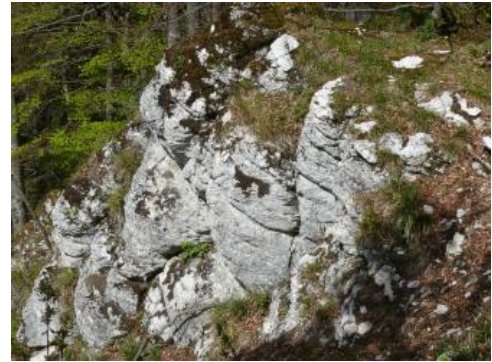
Felswand an der Artleshalde bei Oberdisisheim

Die dichten bis feinkörnigen, brockig-massigen bis meist dickbankig ausgebildeten, weißbeigen, grauweißen, hellgraubeigen und mittelgrauen Kalksteine sind sehr hart, weisen einen glatten bis muscheligen oder rauen Bruch sowie eine unregelmäßige Oberfläche auf. Ganz untergeordnet treten mittelbraune, feinkörnige, harte Kalksteine (= Braunkalke) auf. Die einzelnen Bänke sind 60–100 cm, z. T. 10–30 cm mächtig, und spalten flaserig-knauerig bis unregelmäßig dünnbankig bis plattig auf. Die harten Bankkalksteine zeigen einen rauen Bruch. In Teilabschnitten führen die Massenkalksteine und die unregelmäßig gebankten Bankkalksteine unregelmäßige, linsenförmige, wenige Zentimeter bis 20 cm mächtige Mergelsteinlagen (mergelfaserig). Die Mergelsteinlagen treten in den Felswänden als Hohlkehle zurück. Der Untere Massenkalk weist Bereiche mit unterschiedlich hohen Karbonatgehalten auf.