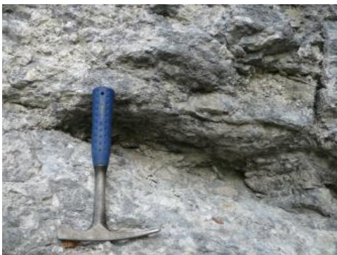
Detailaufnahme der Mittleren Lochen-Subformation an der Hossinger Leiter

(2) Die Mittlere Lochen-Subformation wird aus brockig-massigen bis dickbankigen, dichten, sehr harten, unregelmäßig aufspaltenden hellgrauen Kalksteinen (knauerig-flaserig aufspaltende Kalksteinlagen) mit einer unregelmäßigen Schichtoberfläche aufgebaut. Neben den dickbankigen Partien (30–100 cm mächtige Bänke) kommen noch 10–30 cm mächtige Bänke vor. Z. T. wechseln die Kalksteinbänke mit ca. 10–40 cm starken, hellgrauen Mergelsteinfugen, welche in Felswänden als Hohlkehlen besonders deutlich in Erscheinung treten. Sofern Mergelsteinlagen auftreten, variiert ihr Anteil erheblich. Meist fehlen sie vollständig. Daneben setzt sich diese Abfolge aus dichten, sehr harten, unregelmäßig in 3–10 cm starke Platten/Bänke aufspaltenden Massenkalksteinen zusammen.