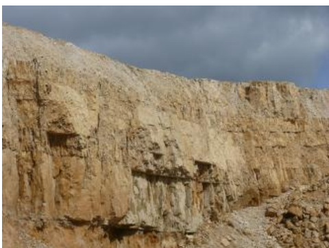
Dickbankige Kalksteine der Mittleren Lochen-Subformation

Die zur Herstellung von Natursteinkörnungen nutzbaren Bankkalksteine (Wohlgeschichtete-Kalke-Formation) und Massenkalksteine (Mittlere Lochen-Subformation) des unteren Oberjuras der südwestlichen und westlichen Schwäbischen Alb bestehen aus einem flächenhaften, schichtig aufgebauten Rohstoffkörper (Schichtfazies), der mit der Lochenfazies im selben stratigraphischen Niveau verzahnt ist. Die Verzahnung dieser beiden Faziesseinheiten geht mit raschen lithologischen Übergängen auf kurzer Distanz und starken Schwankungen der Mächtigkeiten einher. Die Karbonatgesteine der Schichtfazies fallen üblicherweise mit wenigen Grad nach Osten bis Südosten ein. An den Rändern der einzelnen Bioherme (Schwammstotzen der Lochenfazies) fallen die Bank- und Mergelsteine dagegen deutlich steiler in unterschiedliche Richtungen ein. Die Abgrenzungen der dargestellten Lagerstättenkörper sind von