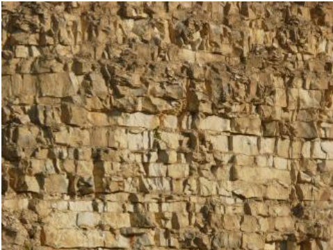
Detailaufnahme aus dem aufgelassenen Steinbruch Albstadt-Pfeffingen