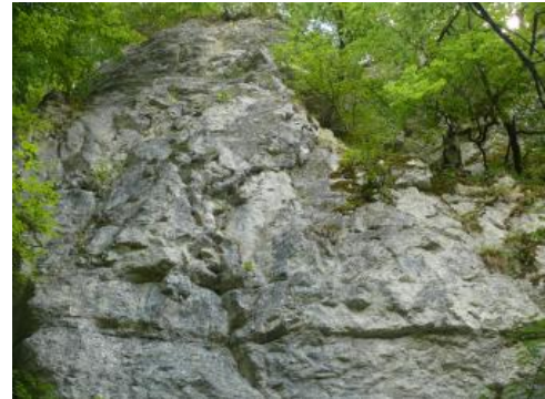
Felswand der Mittleren Lochen-Subformation an der Hossinger Leiter

(1) Die monotonen Bankkalksteine bestehen aus 10–60 cm, im Mittel 20–30 cm mächtigen, hellgraubeigen, dichten Kalksteinen mit 0,2–10 cm mächtigen Mergelsteinzwischenlagen. Die Kalksteine weisen einen glatten bis muscheligen, untergeordnet auch rauen Bruch und eine glatte Schichtoberfläche auf. Der Anteil der hellgrauen Mergelsteinfugen an der Schichtenfolge liegt meist bei etwa 5–10 %, stellenweise bei 20 %. Die Mächtigkeit der Mergelsteinbänke sowie der Mergelsteinanteil (5–25 %) nehmen dabei vom Hangenden zum Liegenden (Impressamergel-Formation) deutlich zu. Häufig treten auf den Kluft- und Schichtflächen Dendriten und charakteristische rostbraune Flecken auf. Die Bankkalksteine verwittern blockig-plattig, die Mergelsteinlagen scherbzig-kleinstückig. Durch die vertikale Klüftung erinnert die Schichtenfolge an ein wohlgeschichtetes Mauerwerk.