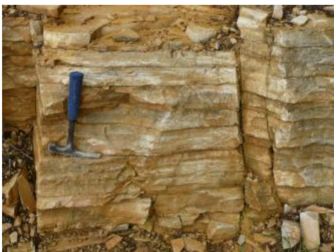
Renquishausen-Plattenkalk im Steinbruch Kolbingen

Es handelt sich um dünnplattige, feinkörnige bis dichte, hellgraubraune, hellbraune, gelbbraune, bis auf Spurenfossilien fossilere und meist umkristallisierte Kalksteine (Dietl et al., 1998) mit rauer Schichtoberfläche. Die einzelnen Platten sind im oberen Teil 1–2 cm stark, dabei nimmt die Plattenstärke nach unten zu. Hellrötlich gefärbte Plattenkalksteine im unteren Teil des oberen, plattigen, gelbbraunen Abschnitts sind offenbar ungeeignet, diese wurden zerkleinert und auf Halde gekippt. Im unteren, gebankten Abschnitt treten 10–30 cm starke, gelbbraune Bankkalksteine mit überwiegend rauer, z. T. auch unregelmäßiger Schichtoberfläche auf, dabei nimmt die Bankstärke nach unten zu. Auf den Schicht- und Klufflächen sind oft Dendriten zu finden. Auffällig sind zahlreiche, unregelmäßige Risse, die in etwa parallel zueinander verlaufen. Diese sind mit Calcit gefüllt. Die Kluffabstände belaufen sich auf 10–120 cm, im Mittel auf 50–70 cm.