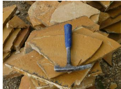
Platten aus Renquishausen-Plattenkalk

Gewinnung: Im Steinbruch Kolbingen (RG 7919-3) werden die Plattenkalksteine zeitweise in kleinen verritzten Arealen abgebaut. Der Abbau erfolgt im Steinbruch mittels Planierdrape und Hammer, die gelösten Platten werden mit der Hand gespalten und vor Ort in einer kleinen Werkhalle oder im Natursteinwerk in Kolbingen in das gewünschte Format gebracht (Werner et al., 2013). Auch im angrenzenden, ehemaligen Steinbruch RG 7919-102 wurden Plattenkalksteine gewonnen. Aufgrund der geringen nutzbaren Mächtigkeit wandert der Steinbruch relativ rasch. In dem Gebiet zwischen Kolbingen und Renquishausen werden seit etwa 300 Jahren „Renquishauser-Plattenkalke“ gebrochen und unter der Handelsbezeichnung „Kolbinger Plattenkalke“ vertrieben.