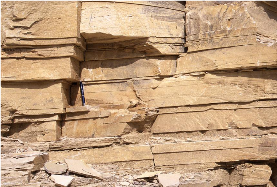
Nusplinger Plattenkalk; regelmäßig geschichtet, im unteren Teil des Steinbruchs