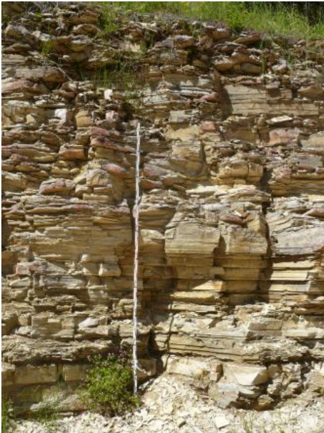
Wechsel von horizontal- und schräggeschichteten Plattenkalken

Geologische Mächtigkeit: Die geologische Mächtigkeit beträgt 10–17 m.