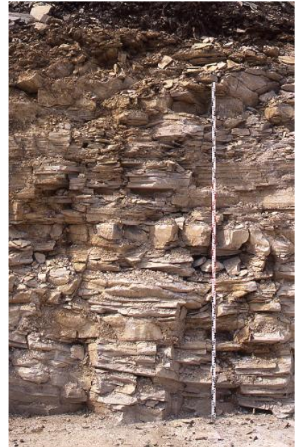
Aufschlusswand im Nusplinger-Plattenkalk

Weitere Informationen finden sie hier: Naturwerksteine aus Baden-Württemberg (2013)/Plattenkalke der Schwäbischen Alb