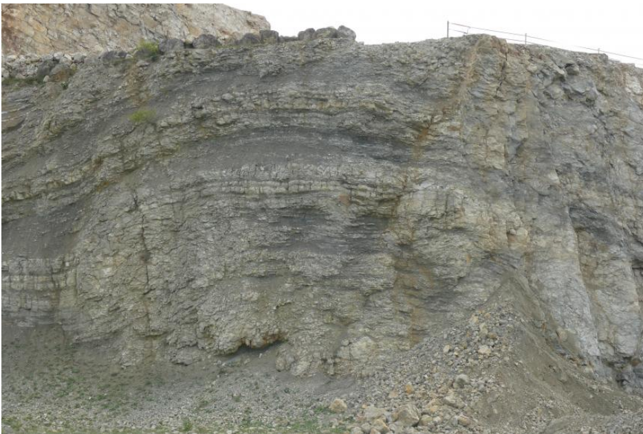
Stark mergelfaserige Bioherme der Unteren Lochen-Subformation

Genutzte Mächtigkeit: Im Steinbruch Plettenberg (RG 7718-1) werden die Karbonatgesteine der Impressamergel- und der Wohlgeschichtete-Kalke-Fm. (Bankkalksteine inkl. Mergelsteinlagen) sowie der Unteren und Mittleren Lochen-Subformation in einer Mächtigkeit von 55–60 m unter Zugabe von Opalinuston aus der nahe gelegenen Tongrube Schömberg (Withau, RG 7818-3) zu Rohmehl für Zementklinker verarbeitet. Die Obere Lochen-Subformation wurde in mehreren Seitenentnahmestellen an der Langen Halde nordöstlich von Nusplingen sowie am Schopfenlöchle südlich von Oberdigisheim in einer Mächtigkeit von 3–5 m für den einfachen Wegebau herangezogen.