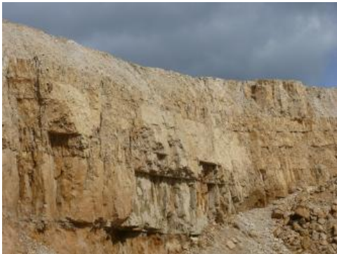
Dickbankige Kalksteine der Mittleren Lochen-Subformation

In der westlichen Schwäbischen Alb können an den Oberläufen der Oberen Bära, der Schlichem und der Eyach vom Liegenden zum Hangenden folgende Gesteine des Oberjuras in Kombination als Zementrohstoffe gewonnen werden: (1) Hellgraue Mergelsteine mit eingeschalteten Kalk- und Kalkmergelsteinbänken der Impressamergel-Fm. (Mächtigkeit: 15–75 m). (2) Stark mergelfaserige Bioherme der Unteren Lochen-Subformation (Mächtigkeit: 15–60 m). (3) Monotone, dichte, hellgraubeige Bankkalksteine (10–50 cm mächtig) mit hellgraubeigen Mergelsteinzwischenlagen (0,2–30 cm mächtig) der Wohlgeschichtete-Kalke-Fm. (Mächtigkeit: 10–90 m). (4) Massige, z. T. dickbankige Kalksteine, untergeordnet mit linsenförmigen Mergelsteinlagen, der Mittleren Lochen-Subformation (Mächtigkeit: 30–150 m). Die Bankkalksteine der Mittleren Lochen-Subformation können in stark absandende, vollständig aus Dolomitstein