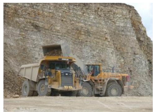
Gebankte Kalksteine mit Mergelsteinlagen der Wohlgeschichtete-Kalke-Formation

Verwendung: Die Eignung dieser Serie ist durch ihre langjährige Nutzung durch das Zementwerk Dotternhausen am Albtrauf der westlichen Schwäbischen Alb nachgewiesen. Die Gesteine können zu Portland- und Spezialzementen verarbeitet werden, die im Hoch- und Tiefbau, für Normalbeton und für sonstige Zementprodukte Verwendung finden.