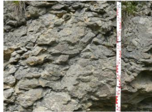
Knaueriger, unregelmäßig aufspaltender Kalkstein. Einzelne linsenförmige Mergelsteinlagen treten als Hohlraum zurück