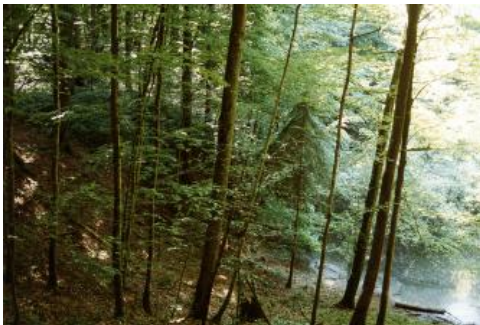
Doline Mördergrube nordöstlich von Steinheim an der Murr

Im Keuperbergland beschränken sich die Karsterscheinungen überwiegend auf den Gipskarst im Verbreitungsgebiet der Grabfeld-Formation (Gipskeuper). Dolinen und Subrosionssenken sind beispielsweise im Naturschutzgebiet Reußenberg bei Crailsheim in typischer Weise ausgebildet.