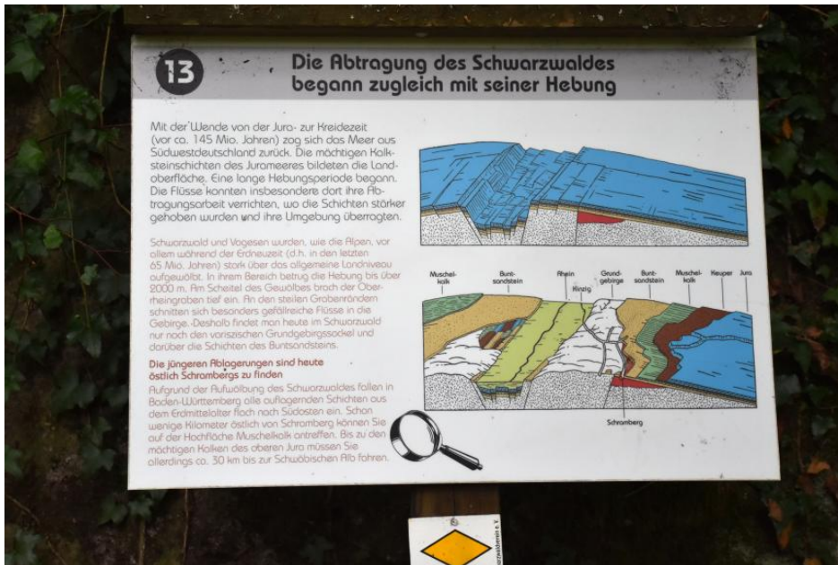
Erklärungen zur Entstehung des Schwarzwaldes am Geologischen Pfad bei Schramberg