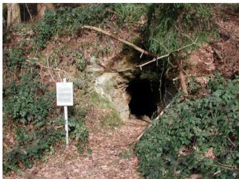
Bergbaugeschichtlicher Wanderweg in Sulzburg

In der Geotouristischen Karte sind für das Oberrhein- und Hochrheingebiet zu geowissenschaftlichen Themen derzeit drei Lehrpfade bei Badenweiler, Kandern und Sulzburg verzeichnet. Sie befinden sich alle im Übergangsbereich vom Markgräfler Hügelland zum Südschwarzwald.