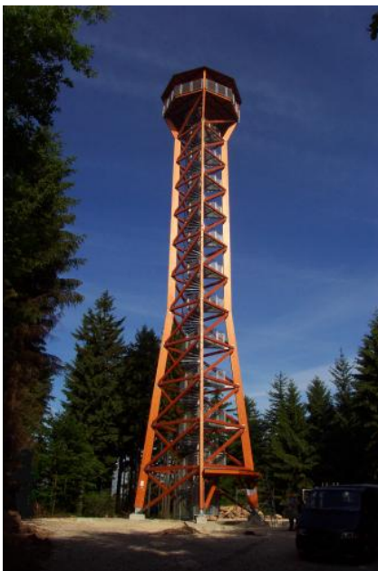
Telttschik-Turm bei Wilhelmshorn

Im Odenwald bieten sich besonders am Rand zum Oberrheingraben, aber beispielsweise auch auf dem Vulkanberg Katzenbuckel oder hoch über dem tief eingeschnittenen Neckartal interessante Aussichten.