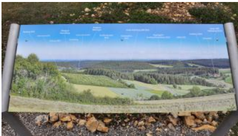
Orientierungstafel auf dem Kapf bei Egenhausen

Die höchsten Punkte der Gäulandschaften befinden sich meist im Westen, am Rand der vom Oberen, im Norden z. T. auch vom Unteren Muschelkalk gebildeten Schichtstufe. Von dort hat man sowohl auf die Ostabdachungen von Schwarzwald und Odenwald, als auch nach Osten über die Schichtstufenlandschaft zum Trauf der Schwäbischen Alb einen weiten Blick. Auch am Rand der tief eingeschnittenen Täler bieten sich beeindruckende Aussichten, ebenso wie neuerdings von dem 2017 eröffneten 246 m hohen Thyssenkrupp-Testturm bei Rottweil mit der höchsten Besucherplattform Deutschlands.