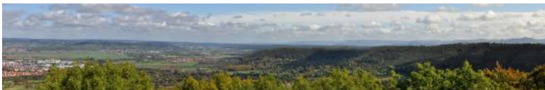
Aussicht von der Weilerburg auf das Neckartal und das Keuperbergland östlich von Rottenburg a. N.

An dieser Stelle sollen nach und nach einige Aussichtstürme und sonstige besondere Aussichtspunkte im Keuperbergland vorgestellt werden. Dazu werden kurze Erklärungen zu Landschaft und Geologie sowie Verlinkungen zu den weiterreichenden fachlichen Inhalten in LGRBwissen angeboten.