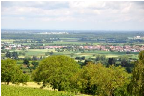
Vom Heubergturm bei Ettenheim blickt man über Mahlberg-Orschweier nach Norden in die Offenburger Rheinebene

Im Oberrheingebiet sind es v. a. die Erhebungen der Vorbergzone sowie die Vulkanruine des Kaiserstuhls, die schöne Aussichten auf die Oberrheinebene, den angrenzenden Schwarzwald und die Vogesen bieten. Vom Dinkelberg lässt sich über das Hochrheintal bis zu den Alpen blicken. An mehreren Stellen bieten Aussichtstürme eine weite Rundumsicht.