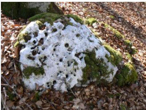
„Lochfels“ im Oberjura-Massenkalk bei Veringerstadt

Die karbonatischen Gesteine des Oberjuras neigen zur Verkarstung (Karbonatkarst). Im Landesgebiet treten sie hauptsächlich im Bereich der Schwäbischen Alb bis in das Randengebiet südlich der Donau zu Tage. Randschollen des südlichen Oberrheingrabens enthalten kleine Ausstrichgebiete des Oberjuras.