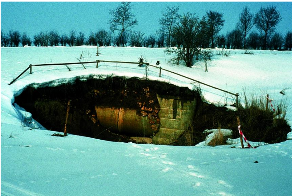
Einsturzdoline (Erdfall) in den Gesteinen der Oberjura-Massenkalk-Formation bei Bühlenhausen