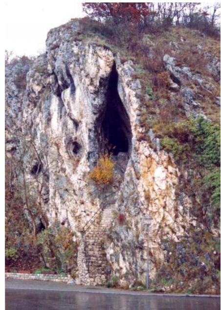
Die Geisterhöhle bei Rechtenstein (Alb-Donau-Kreis)