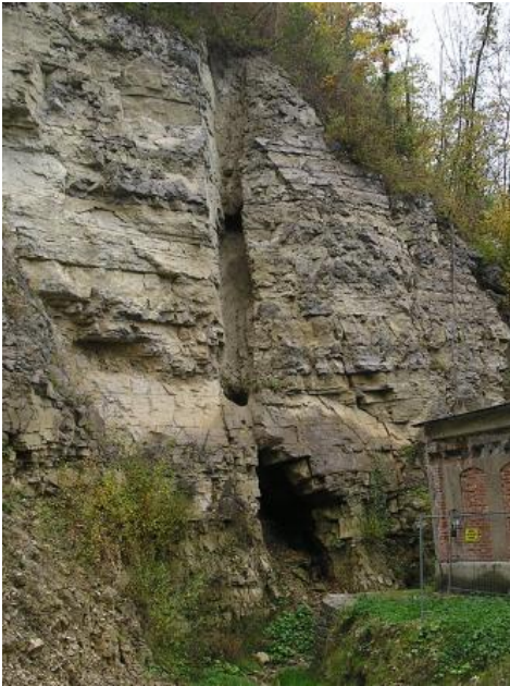
Karstschlotte mit Hohlraum im Oberen Muschelkalk

Die Entstehung der Kluftsysteme, über denen sich die Dolinen befinden, hängt zudem mit der Auslaugung von Salz, Gips und Anhydrit der Schichten des unterlagernden Mittleren Muschelkalks zusammen. Durch Nachsacken über den entstandenen Subrosionshöhlräumen ist die steife Decke des Oberen Muschelkalks meist hangparallel aufgerissen worden (Vollrath, 1977). Mit dem Abtauchen des Mittleren Muschelkalks, einhergehend mit einem steigenden Anteil an vorhandenem, nicht ausgelagerten Gips und Anhydrit, nimmt die Häufung der Dolinen an der Muschelkalkoberfläche erheblich ab (Wolff, 1988).