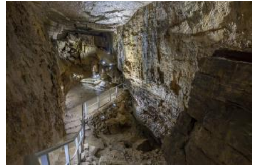
Erdmannshöhle bei Hasel

Diese Verkarstungsprozesse sind auch in den prominentesten Höhlen im Oberen Muschelkalk des südlichen Schwarzwalds zu finden, welche sich im Gebiet des Dinkelbergs zwischen Rheinfeldern und Schopfheim befinden. Dort sind im Untergrund des Dinkelbergs vier größere Höhlen vorhanden, von denen die Erdmannshöhle bei Hasel sowie die Tschamberhöhle bei Rheinfeldern-Karsau öffentlich zugänglich sind.