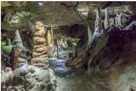
Erdmannshöhle bei Hasel

Die Erdmannshöhle mit einer Gesamtlänge von 2315 m (Piepjohn et al., 2005) und einem Schauteil von ca. 360 m ist gekennzeichnet durch zahlreiche, teils große Tropfsteine. Die Höhle ist eine typische Schichtfugen- und Klufthöhle, deren Hohlraumlage durch die nahezu sählig liegenden Schichten des Oberen Muschelkalks und die steilstehenden vorherrschenden Klufthöhle bestimmt wird (Piepjohn et al., 2005).