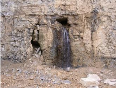
Grundwasseraustritt aus Karsthohlräumen in einem Steinbruch bei Ditzingen