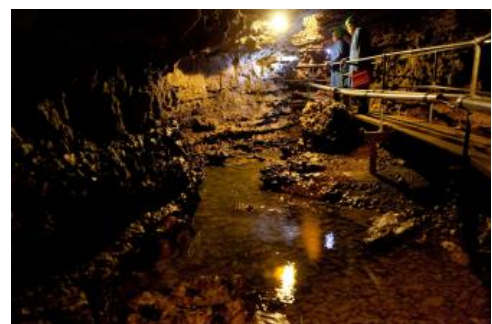
Tschamberhöhle bei Karsau (Rheinfeldern)

Eine der bekanntesten Höhlen im Oberen Muschelkalk (Trigonodusdolomit) des Wutachtals ist das sogenannte Münzloch bei Bad Boll. Die Höhle liegt am linken Talhang etwa 40–50 m über der Talsohle. Von dem Eingang reicht ein sich absenkender, aus abgelöstem Gesteinstrümmerwerk bestehender Schuttkegel bis mitten in die Höhle hinein. Letztere besitzt eine größte Breite von 6–8 m und eine zugängliche Längenerstreckung in der Richtung Süd–Nord von ca. 20 m (Schalch, 1906). Der Überlieferung nach wurde die Höhle einst von einer „Falschmünzerbande“ als Werkstatt genutzt, wonach sie ihren Namen erhielt. In schweren Zeiten diente die Höhle der örtlichen Bevölkerung, aufgrund der erschwerten Zugänglichkeit, als sicheres Versteck.