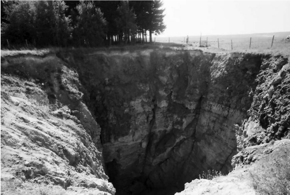
Ansicht der Einsturzdoline 1954 bei Göschweiler von Norden

In beiden Fällen versickern auf kurzer Strecke verhältnismäßig große Wassermengen im Kalkgestein und führen dort zu intensiven Lösungsvorgängen: