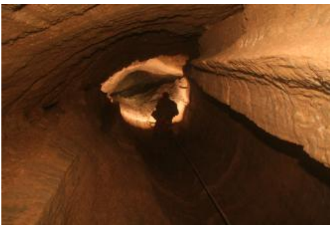
Innenansicht der am 27.09.2013 zu Tage gebrochenen Doline