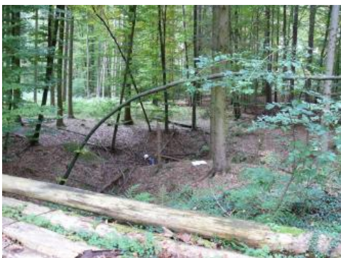
Doline in einem Waldstück bei Vaihingen an der Enz

Der Obere Muschelkalk setzt sich aus einer Folge von Dolomitsteinen, Kalksteinen, dolomitischen Kalksteinen und Tonmergelsteinen zusammen und wird von den Tonsteinen der Erfurt-Formation (ehemalige Bezeichnung Lettenkeuper) des Unterkeupers überlagert. Über den oberflächennah anstehenden Karbonatgesteinen des Oberen Muschelkalks folgt verbreitet eine meist nur geringmächtige Decke aus steinigem Verwitterungslehm. Weitere Angaben zur Geologie des Oberen Muschelkalks finden sich im Themenast Geologie.