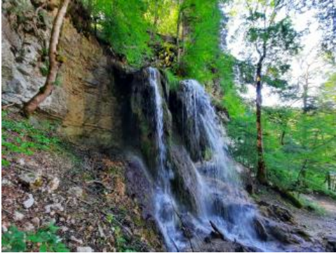
Kalksinter in der Wutachschlucht bei Boll

Die auf den Muschelkalkhochflächen versickernden Niederschläge lösen wie eingangs beschrieben den Kalk. Das mit Calciumbikarbonat angereicherte und in Quellen (bevorzugt entlang wasserstauenden Horizonten wie z. B. im Mittleren und Unteren Muschelkalk) wieder zutage tretende Wasser führt dort zur Ausfällung und Ablagerung von Kalktuff (Süßwasserkalk). Solche Tuffablagerungen, teilweise in Terrassenform, sind z. B. an den Quellen in den Wutachhängen zu beobachten, deren Wasser dem Muschelkalk entstammt (Bangert, 1991).