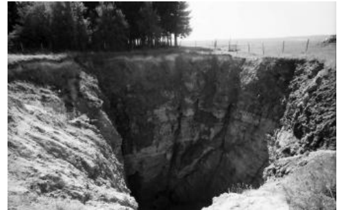
Ansicht der Einsturzdoline 1954 bei Göschweiler von Norden

Am Nachmittag des 10. Januar 1954 ereignete sich im Ortsteil Göschweiler (Stadt Löffingen) im Gewinn Roßhag ein eindrucksvoller Erdfall, bei dem eine ca. 20 m breite Doline einstürzte und einen ca. 40 m tiefen, nahezu senkrechten Schlot freigab. Der Einsturz wurde durch ein dumpfes Grollen wahrgenommen und konnte sogar von der Erdbebenwarte Basel registriert werden. 2013 stürzte ein 70-jähriger Mann in die Doline Göschweiler, der von der Bergwacht mit einem Helikopter gerettet werden musste.