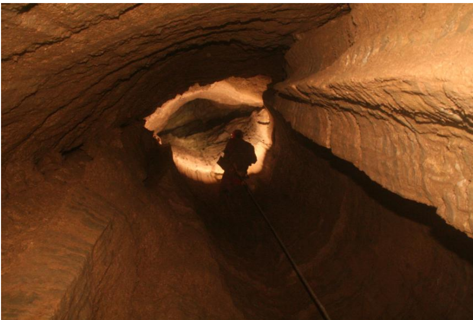
Innenansicht der am 27.09.2013 zu Tage gebrochenen Doline