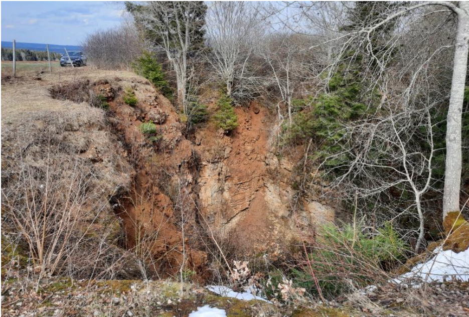
Ansicht der Einsturzdoline bei Göschweiler im Jahr 2021