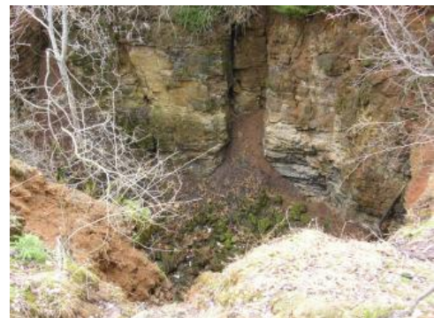
Ansicht der Einsturzdoline bei Göscheweiler im Jahr 2005

Der Einbruch von 1954 liegt am Nordrand einer alten, 80 m nach Süden langgestreckten, vermutlich 1903 eingestürzten Doline, die teilweise verfüllt und zwischenzeitlich mit alten Bäumen bewachsen ist. Grundsätzlich ist eine Verbindung nach Süden, also zur Wutach hin, zu mutmaßen. So konnte z. B. der Wirt der Schattenmühle in den Tagen unmittelbar nach dem Einbruch 1954 eine Trübung seiner Quelle beobachten, welche im Tobel zwischen Schelmenhalde und Glöcklerhalde im Grenzgebiet vom Mittleren zum Oberen Muschelkalk austritt. Da zum Ereigniszeitpunkt die Temperaturen unter dem Gefrierpunkt lagen, ist eine Trübung durch Niederschläge auszuschließen. Darüber hinaus existieren zwei deutliche Senken in der streichenden Fortsetzung nach Südwesten sowie im Gewinn „Lochäcker“. So besteht die berechnete Annahme, dass es sich bei dem Dolineneinbruch um ein beachtliches Ergebnis eines nach Nordosten fortschreitenden, unterirdischen Zubringers der Wutach handelt, der das lebendige geologische Geschehen in dieser Gegend eindrücklich dokumentiert.