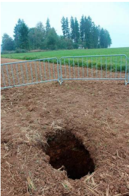
Erdfall vom 27.09.2013

Die beschriebenen Lösungsprozesse dauern bis heute an und führen immer wieder zu Problemen. Neben dem eindrucklichen Tagbruch der Einsturzdoline vom Januar 1954 ist es auf den Acker- und Wiesenflächen in den Gewannen Roßhag, Lautenlinden, Oberholz und Lochhäcker immer wieder zu kleineren Bodeneinsenkungen und Einbrüchen gekommen, die rasch verfüllt und häufig nicht weiter gemeldet wurden. Am 27.09.2013 brach auf dem als Acker genutzten Flurstück Nr. 1230/1 im Gewann Roßhag bzw. Lautenlinden der Gemarkung Göschweiler beim Befahren mit einem Traktor eine Doline ein.