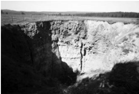
Ansicht der Einsturzdoline 1954 bei Gösweiler von Süden

Am Ereignistag wurde der Erdfall (Einsturzdoline) durch einen Jäger als „großes schwarzes Loch“ mit einem Durchmesser von 10 m beschrieben, welches sich markant von der mit Schnee bedeckten Umgebung abhob (Sauer, 1954). Als eine Zwischentauperiode einsetzte, vergrößerte sich der Durchmesser. Mit dem Ende des Winterfrostes wiederholte sich dieser Effekt. Am 22.03.1954 hatte das runde Loch einen N–S-Durchmesser von etwa 18 m und einen O–W-Durchmesser von ca. 20 m. Im Laufe des Frühjahrs und Frühsommers gefallene Niederschläge förderten ein weiteres Abbrechen der Ränder.