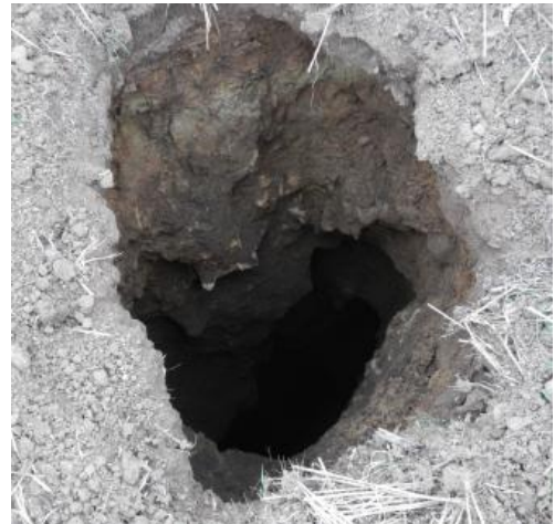
Detailansicht des Erdfalls vom 27.09.2013