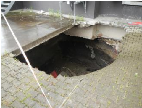
Erdfall bei einem ehemaligen Einkaufsmarkt in Schweningen vom Mai 2013

Gebiete mit fossiler und rezenter Gipsauslaugung stellen stets einen schwierigen Baugrund dar. Rezente Gipsauslaugung, einhergehend mit meist ungleichmäßigem Volumenverlust führt zu ungleichmäßigen Setzungen des Untergrunds. Auch können ungleichmäßige Bauwerksetzungen und folglich Gebäudeschäden auftreten, wenn z. B. Bauwerke teils auf unverkarstetem hartem Fels, teils auf setzungsfähigen Auslaugungsrückständen mit unterschiedlichem Verwitterungsgrad oder gar auf lehmigen bis anmoorigen Dolinenfüllungen errichtet wurden (Carlé, 1980; Wagenplast, 2005).