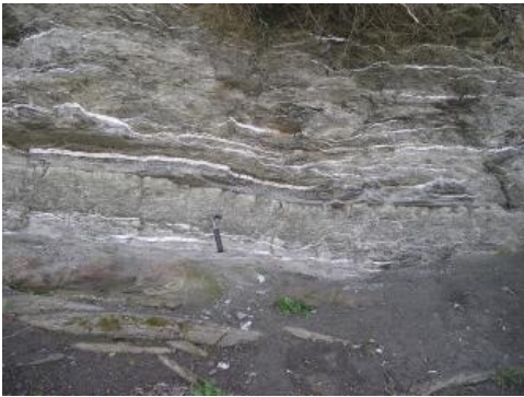
Dünne Sulfatlagen und -adern in der Mittleren Grabfeld-Formation (Mittlerer Gipschizont)