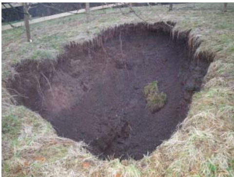
Erdfall auf einer Streuobstwiese östlich von Schlechtbach vom 08.02.2011

Die Gesteine der Grabfeld-Formation (ehemalige Bezeichnung: Gipskeuper) aus dem untersten Mittelkeuper neigen aufgrund ihres Sulfatgehalts in sehr hohem Maße zur Verkarstung bzw. unterliegen der Auslaugung. Eine maximale Tiefenlage verkarstungsfähiger Gesteinshorizonte der Grabfeld-Formation von 110 m unter Geländeoberkante (GOK), von der aus sich Verkarstungsstrukturen noch bis an die GOK durchpausen können, wurde empirisch durch Auswertung der bekannten Verkarstungsobjekte bestimmt. In Baden-Württemberg wird eine Verkarstungsgefährdung aufgrund der im Untergrund anstehenden Gesteine der Grabfeld-Formation im Bereich der Gäulandschaften sowie dem Keuperbergland in der ingenieurgeologischen Gefahrenhinweiskarte für Baden-Württemberg (IGHK50) ausgewiesen.