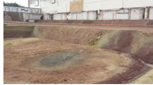
Plombierte Doline in der Baugrube des neuen Stuttgarter Hauptbahnhofs

In bebauten Gebieten können Auslaugungsvorgänge – vor allem in den Gesteinen der Grundgipsschichten sowie des Mittleren Gipshorizonts – erhebliche Probleme bereiten und zu Gebäudeschäden führen. Schäden in der Eltinger Altstadt (Leonberg, Lkr. Böblingen) oder in Stuttgart sind bekannte Beispiele hierfür. Auch mussten einzelne Gebäude bereits abgerissen werden (Ströbel & Wurm, 1994; Brunner, 1998b).