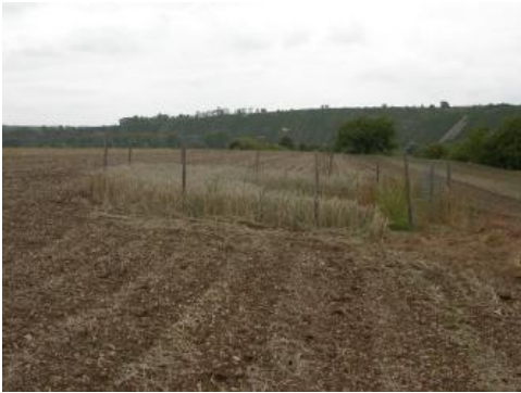
Erdfall bei Besigheim

An der Oberfläche bzw. oberflächennah sind die Sulfatgesteine des Mittleren Muschelkalks teilweise bereits vollständig ausgelaugt und die besonders stark lösungsfähigen Salzgesteine sind hier bereits vollständig aufgelöst. Daher wird in den Ausstrichbereichen der Talflanken und Talsohlen meist eine stark reduzierte Mächtigkeit des Mittleren Muschelkalks (bis auf 15–20 m) beobachtet. Im tieferen Untergrund hält der Auslaugungsprozess durch einsickernde Wässer noch an (Huth, 1999).