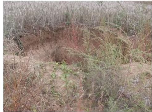
Erdfall bei Besigheim

Die oberste Formation ( Diemel-Formation ) sowie die unterste Formation ( Karlstadt-Formation ) des Mittleren Muschelkalks sind überwiegend aus Karbonatgesteinen aufgebaut und somit grundsätzlich verkarstungsfähig (Karbonatkarst). Im unteren Teil der Karlstadt-Formation schalten sich in südlicher Richtung folgend zudem allmählich Sulfatgesteine ein. Diese Sulfatgesteinslage (Geislingen-Bank) ist zunächst als vereinzelte Sulfatknollen entwickelt, bevor sie im Gebiet des südlichen Hohenlohe sukzessiv als eine massive Sulfatbank ausgebildet ist und die erste saline Ablagerung im Mittleren Muschelkalk bildet. Über der Karlstadt-Formation schließt sich die Sulfat- und Salzgestein-führende Heilbronn-Formation an. Diese weist im unausgelaugten Zustand gegenüber der Diemel-Formation oder der Karlstadt-Formation jedoch eine weitaus größere Mächtigkeit (bis zu 100 m) auf und ist daher maßgebend für die im Mittleren Muschelkalk auftretenden Verkarstungs-/Auslaugungsprozesse (Sulfat-/Salinarkarst).