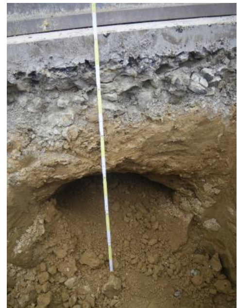
Röhrenartiger Hohlraum in quartärem Lösslehm

Das eingebrochene Material wird dabei oftmals durch das fließende Wasser abtransportiert, wodurch sich der Prozess weiter fortsetzen kann. Da die Hohlräume im Lockergestein nicht standfest sind, verbrechen diese schnell und bilden die o. g. Strukturen an der Oberfläche aus.