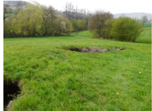
Mehrere kettenförmig angeordnete Pseudokarststrukturen

Die Entstehung von Pseudokarsterscheinungen beruht auf physikalischen Prozessen. Bei der sogenannten Suffosion werden Lockergesteine im Untergrund im Bereich von fließenden Sicker- bzw. Grundwässern abgetragen. Die Entstehung solcher Strukturen setzt ein durchlässiges Lockergestein wie beispielsweise Löss sowie eine gering wasserdurchlässige (Gesteins-)Barriere an deren Basis voraus.