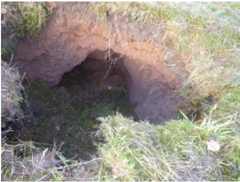
Verbrochene Hohlraumstruktur elliptischer Grundform in quartärem Hangschutt/Fließerde

Die Erdfallstrukturen sind meist entlang der unterirdischen Fließpfade kettenförmig angeordnet. Am unteren Rand des Hangareals bzw. von Erdfallketten treten oftmals die Suffosionskanäle zutage und das im Untergrund abtransportierte, feinkörnige Lockergestein wird in Form von flachen Schwemmkegeln (Schwemmflächen) abgelagert. Die Schwemmkegel zeichnen sich meist durch Quellaustritte und Vernässungszonen mit teils randlichen Wällen aus schluffigen Sedimenten sowie allgemein durch frische Sedimentablagerungen aus.