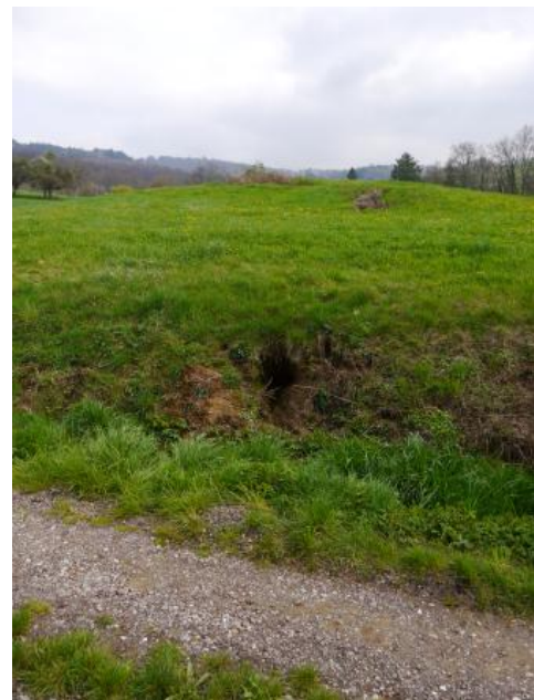
Schwemmkegel mit Austritt eines Suffosionskanals und abgelagertem, feinkörnigem Bodenmaterial

Die Erdfallstrukturen sind meist entlang der unterirdischen Fließpfade kettenförmig angeordnet. Am unteren Rand des Hangareals bzw. von Erdfallketten treten oftmals die Suffosionskanäle zutage und das im Untergrund abtransportierte, feinkörnige Lockergestein wird in Form von flachen Schwemmkegeln (Schwemmflächen) abgelagert. Die Schwemmkegel zeichnen sich meist durch Quellaustritte und Vernässungszonen mit teils randlichen Wällen aus schluffigen Sedimenten sowie allgemein durch frische Sedimentablagerungen aus.