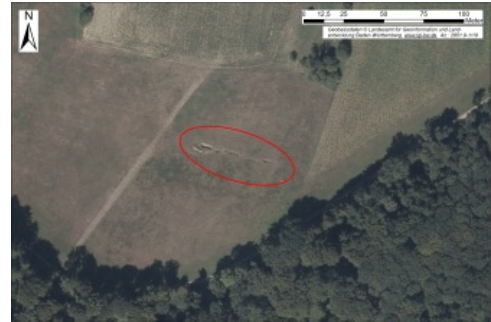
Orthofoto einer Erdfallkette

Hinweise auf Verkarstung in den unter den Lösssedimenten anstehenden Gesteinen des Muschelkalks wurden nicht beobachtet.