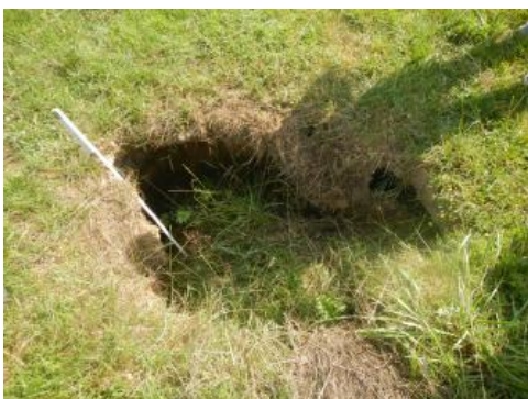
Erdfall auf dem Grundstück der Domäne Hochburg

Auf dem Gebiet der Staatsdomäne Hochburg sind bereits zahlreiche Erdfälle bekannt und es treten hier immer wieder neue Erdfälle auf. Diese betreffen sowohl Acker- und Weideflächen, als auch geteerte Wirtschaftswege.