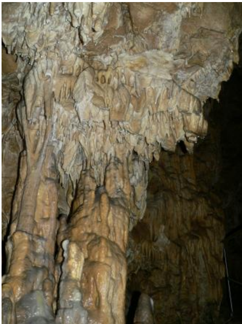
Kolbinger Höhle (Stephanshöhle), Kolbingen

Höhlen als Einstiege in die Unterwelt sind in Baden-Württemberg zahlreich zu finden und ziehen jedes Jahr viele Besucher in ihren Bann. Als typische Karsterscheinungen sind sie durch Kalklösung entstanden und in Baden-Württemberg deshalb im Wesentlichen auf das Verbreitungsgebiet von Muschelkalk und Oberjura beschränkt. Besonderheiten stellen die Olgahöhle in Honau und die Zwiefaltendorfer Tropfsteinhöhle als geologisch junge Tuffhöhlen in mächtigen Sinterterrassen dar. Andere Gesteine, wie beispielsweise im Buntsandstein oder Stubensandstein, neigen nur selten zur Höhlenbildung. Im Gegensatz zu den Karsthöhlen handelt es sich in den Sandsteinen meist um relativ kleine Objekte wie Hohlkehlen nach Unterspülungen, Blockhöhlen als Zwischenräume oft großer Blockhalden oder um Verwitterung weicher Sandsteinhorizonte.