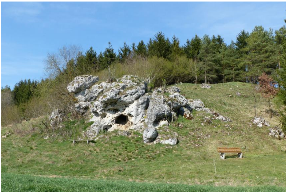
Hohler Stein bei Neresheim-Köisingen

Neben den Besucherhöhlen gibt es im Land zahlreiche weitere Höhlen und Hohlräume, die zwar nicht den Bekanntheitsgrad und die Bedeutung der Besucherhöhlen haben, deren Besuch sich aber dennoch lohnt. Viele dieser Höhlen sind frei zugänglich und ohne Gefahr zu betreten. Ihr Reiz liegt eher im eigenen Erkunden und regt besonders bei Kindern die Phantasie an. Die Höhlen sind häufig leicht erreichbar und liegen an oder in der Nähe von Wanderwegen.