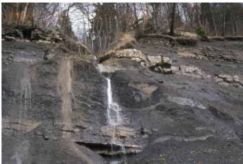
Bergbruchsgebiet am Eichberg, Blumberg

Das Profil am Scheffheu, durch die Eschacher Hangrutschung 1880 sowie eine weitere 1940 erschlossen, ist im unteren Bereich bereits verstrützt. Aufgeschlossen sind die Achdorf-Formation (früher Braunjura beta) und die Wedelsandstein-Formation (früher Braunjura gamma). Ursprünglich war auch ein Teil der Opalinuston-Formation (früher Braunjura alpha) aufgeschlossen. Der Aufschluss zeichnet sich durch Fossilreichtum, Wühl-, Kriech- und Fraßspuren, eisenoolithische Schichten, Konkretionen und bis 2 mm große Pyritkugeln aus, die meist an Fossilien gebunden sind.