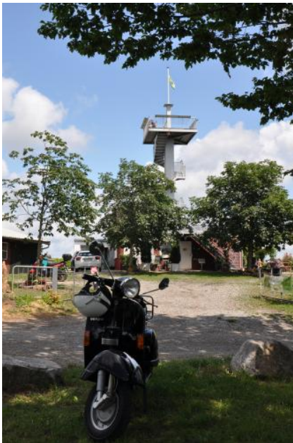
Der Heubergturm bei Ettenheim

Mitten in den Weinbergen südlich von Ettenheim wurde auf 282 m ü. NHN der 12,5 m hohe Heubergturm errichtet, der eine schöne Rundumsicht gewährt. Im Westen überblickt man den Süden der Offenburger Rheinebene und schaut bei klarer Sicht bis zu den Vogesen. Im Südwesten ist die Vulkanruine des Kaiserstuhls zu erkennen. Wendet man sich nach Osten, hat man den Mittleren Schwarzwald vor sich, mit dem Ausgang des Ettenbachtals bei Ettenheim-Münchweiler. Während die höheren Berge im Hintergrund von Gesteinen des Grundgebirges, meist Gneisen, gebildet werden, ist das niedrigere bewaldete Bergland davor überwiegend aus Buntsandstein aufgebaut. Es gehört geologisch noch zur Vorbergzone und ist durch die Haupttrandverwerfung vom Grundgebirgsschwarzwald abgesetzt.