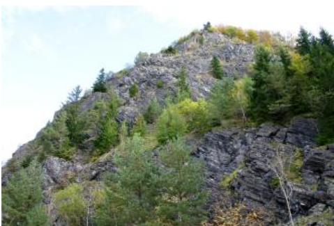
Der Steinbruch am Gipfel des Hohenstoffeln

Die Ursache für den Vulkanismus im Hegau liegt in seiner Lage im Kreuzungspunkt der Freiburg–Bonndorf–Bodensee-Störungszone und der Albstadt-Störungszone. Im Bereich dieser Verwerfungen in der Erdkruste drang vor etwa 15 Mio. Jahren zunächst stark gashaltiges Magma auf, was zu explosiven Ausbrüchen führte. Dabei wurden die heute noch bis über 100 m mächtigen Deckentuffe ausgeworfen. Eine Besonderheit des Deckentuff-Vulkanismus stellen die Maare dar. Hier blieben nach dem jeweils letzten Ausbruch über den Förderschloten wasserundurchlässige Senken zurück, in denen sich Seen bildeten. In den Seesedimenten wurden zahlreiche Fossilien gefunden, wie das weltweit bekannte Urpferd Hippotherium primigenium aus den Höwenegg-Schichten oder der Riesensalamander Andrias scheuchzeri aus dem Öhningen-Kalkstein. Von den Schloten ausgehend verzahnen sich die Deckentuffe mit den Mergeln, Konglomeraten und Kalksanden der tertiären Jüngerer Juranagelfluh. Diese Sedimente wurden von Nordwesten her in die Randbereiche des Molassebeckens im Alpenvorland geschüttet.