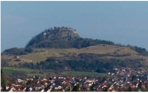
Der Hohentwiel von Nordwesten