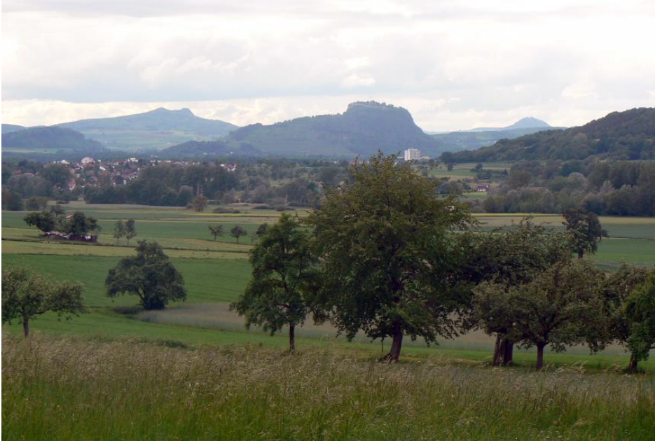
Der Hegau von Süden

Die Ursache für den Vulkanismus im Hegau liegt in seiner Lage im Kreuzungspunkt der Freiburg–Bonndorf–Bodensee-Störungszone und der Albstadt-Störungszone. Im Bereich dieser Verwerfungen in der Erdkruste drang vor etwa 15 Mio. Jahren zunächst stark gashaltiges Magma auf, was zu explosiven Ausbrüchen führte. Dabei wurden die heute noch bis über 100 m mächtigen Deckentuffe ausgeworfen. Eine Besonderheit des Deckentuff-Vulkanismus stellen die Maare dar. Hier blieben nach dem jeweils letzten Ausbruch über den Förderschloten wasserundurchlässige Senken zurück, in denen sich Seen bildeten. In den Seesedimenten wurden zahlreiche Fossilien gefunden, wie das weltweit bekannte Urpferd Hippotherium primigenium aus den Höwenegg-Schichten oder der Riesensalamander Andrias scheuchzeri aus dem Öhningen-Kalkstein. Von den Schloten ausgehend verzahnen sich die Deckentuffe mit den Mergeln, Konglomeraten und Kalksanden der tertiären Jüngerer Juranagelfluh. Diese Sedimente wurden von Nordwesten her in die Randbereiche des Molassebeckens im Alpenvorland geschüttet.