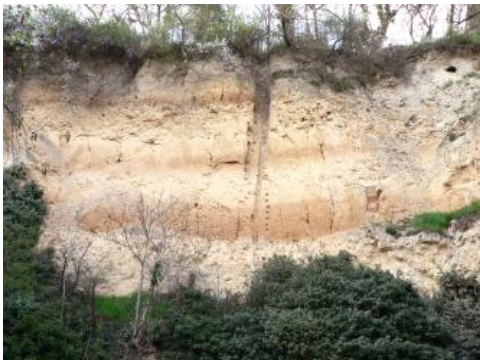
Lösswand hinter der Brauerei von Riegel am Kaiserstuhl

Die ca. 35 m hohe Aufschlusswand hinter der ehemaligen Brauerei von Riegel am Kaiserstuhl zeigt eine mächtige Abfolge mehrerer Lössgenerationen mit deren Bodenbildungen und Überdeckung durch die nächst jüngeren Lössschichten. Jede dieser Schichtfolgen schließt nach oben mit einer Bodenentwicklung (braune Bodenschichten) ab, die nach Entkalkung aus dem primär kalkreichen, hellgelben Rohlöss stattgefunden hat. Der jeweils weggelöste Kalk fiel in Form von Kalkkonkretionen und Lösskindl unterhalb der Paläoböden wieder aus. Die genauen stratigraphischen Abfolgen sind allerdings nicht gesichert, da es immer wieder zu Verschwemmungen, Erosion und Umlagerungen kam. Dies gilt vor allem für die tieferen Lösslagen unter dem dritten braunen Band (von oben). Im Liegenden der Lösswand stehen unter einem roten Band aus pliozänem Lehm verkarstete Kalksteine der Hauptrogenstein-Formation an.