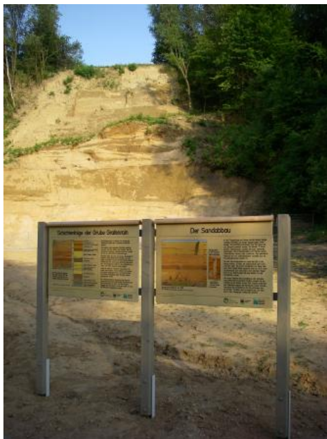
Aufgelassene Sandgrube im Gewann Grafenrain nördlich von Mauer bei Heidelberg (Mauer-Sande)

Die am Nordwestrand von Mauer gelegene Sandgrube Grafenrain ist der Fundort des weltberühmten Unterkiefers des Homo heidelbergensis , der hier 1907 ausgegraben wurde. Die Sandgrube ist seit 1962 aufgelassen, wurde nur teilweise rekultiviert und ist heute stark verwachsen. Im Bereich der Fundstelle wurde ein breites Sandprofil wieder freigelegt, ein Lackprofil dieser Schichten befindet sich mit weiteren bedeutenden Ausstellungsstücken im Urgeschichtlichen Museum im Rathaus Mauer. Die Sande und Kiese in der Umgebung von Mauer wurden durch einen mittelpleistozänen Neckarlauf abgelagert, als der Neckar bei Neckargemünd nach Süden abzog und den langgestreckten Rücken des Hollmut umfloss. Infolge von Hebungsprozessen im Odenwald bei gleichzeitiger Absenkung des Kraichgaus verschob und vergrößerte der Neckar die Schlinge immer weiter nach Süden. Bis der Fluss dann den schmalen Schlingenhals bei Neckargemünd durchbrach und dadurch seinen Lauf um gut 8 km verkürzte, setzte er in Zehntausenden von Jahren etwa 30 m Sande und Tone ab (Mauer-Sande). Während der Riß- und Würmeiszeit wurden die Flussablagerungen von etwa 10 m Löss überdeckt. Die Fundschicht des Unterkiefers liegt etwa 25 m unterhalb der heutigen Landoberfläche. Aus neueren Datierungsversuchen wurde ein Alter von 609\ 000 \pm 40\ 000 Jahren abgeleitet. Neben diesem bedeutenden Hominidenfund wurden in diesem Bereich auch viele Knochen und