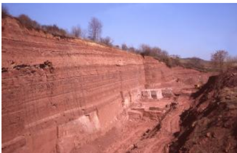
Steinbruch im Oberen Buntsandstein östlich von Wertheim-Dietenhan

Der Steinbruch östlich von Dietenhan zeigt das mächtigste Aufschlussprofil im Oberen Buntsandstein im Wertheimer Raum. In dem tiefen Werksteinbruch werden sehr homogene feinkörnige Sandsteine aus dem oberen Teil der Plattensandstein-Formation abgebaut, die hier eine Mächtigkeit von 4–6 m aufweisen. Es sind sehr gesuchte Werksteine für Restaurierungszwecke und als Bildhauerstein (Roter Mainsandstein). Deshalb rechnet es sich immer noch, die darüber liegenden 10–25 m mächtigen Abraumschichten aus den Unteren Röttonen abzugraben.