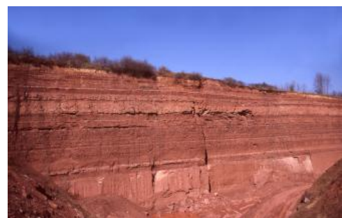
Steinbruch im Oberen Buntsandstein östlich von Wertheim-Dietenhan

Die Rötton-Formation besteht aus roten bis rotbraunen Ton- und Silttonsteinen, in die immer wieder quarzitisch gebundene Sandsteinlagen eingeschaltet sind, vor allem im oberen Teil. Der Rötquarzit ist mittlerweile an der nördlichen Abbaukante aufgeschlossen. Infolge des Abtauchens der Schichten nach Westnordwesten nimmt die Abbaumächtigkeit von Osten nach Westen zu.