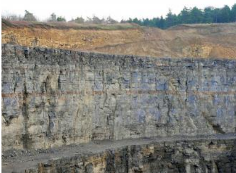
Muschelkalk-Steinbruch am Höhberg östlich von Werbach

Im großen Steinbruch und Schotterwerk am Höhberg ca. 1500 m östlich von Werbach ist Unterer und Mittlerer Muschelkalk aufgeschlossen. Die Steinbruchsohle liegt nur ca. 6 m über der Grenze zum Oberen Buntsandstein. Über den unteren Wellenkalken (Jena-Formation) folgen die Buchimergel mit bis zu 6,2 m Mächtigkeit, darüber dann Wellenkalk bis zur Grenze zum Mittleren Muschelkalk. Mehrere Leitbänke sind in der Abbauwand recht gut zu erkennen, wie die Untere und Obere Spiriferinabank sowie die Untere und Obere Schaumkalkbank. Darüber beginnt der Mittlere Muschelkalk mit der Karlstadt-Formation, über der dann Untere Dolomite folgen. Die Salinar-Formation ist hier stark ausgelaugt und besteht außer aus Gipsresten aus dolomitischen, schluffig-tonigen Auslaugungsgesteinen. Im höheren Abraumbereich treten schließlich noch Dolomitsteine der Oberen Dolomit-Formation auf.