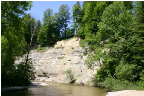
Prallhang der Unteren Argen nordwestlich von Isny im Allgäu-Neutrauchburg

Der Prallhang der Unteren Argen liegt im Allgäu, nordwestlich von Isny-Neutrauchburg. Er zeigt eine rund 20 m hohe Abfolge von Sedimenten der Oberen Süßwassermolasse, welche für die Randbereiche des Adelegg-Berglands typisch ist. Während in der Adelegg vor allem verfestigte Konglomerate (Nagelfluh) dominieren, unterbrochen von nur geringmächtigen sandigen und mergeligen Lagen, werden die Sedimente zum Randbereich hin deutlich feinkörniger. Aufgeschlossen sind hier fluviatile Konglomerate, dann Sandstein und vor allem sandige Mergelsteine, in die sich die Argen relativ leicht einschneiden konnte. Harte und zu Nagelfluh verbackene Konglomerate der Adelegg sind im Flussbett der Argen als gerundete Grobkiese leicht zu finden und stehen in deutlichem Kontrast zu den eher weichen, mergeligen Gesteinen, die zu quelligen Hängen und Rutschungen neigen.