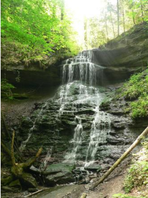
Hinterer Wasserfall des Hörschbachs nordwestlich vom Hörschkopf

Das Hörschbachtal gabelt sich schließlich im Bereich der Hassberge-Formation (Kieselsandstein) auf. Unmittelbar oberhalb des durch einen kleinen Talboden gekennzeichneten Gabelungspunkts befinden sich in beiden Klingenästen je ein durch harte Kieselsandsteinbänke verursachter Wasserfall. Der große Hintere Hörschbach-Wasserfall ergießt sich über mehrere Kaskaden mit einer Gesamthöhe von etwa 12 m. Bereits tief entwickelte Hohlkehlen wurden teilweise durch Kalktuffabsätze wieder aufgefüllt. Oberhalb des Wasserfalls befindet sich ein kleiner Weiher. Durch Ablassen des aufgestauten Wassers lässt sich der Abfluss kurzzeitig erhöhen. Wasserfallstufen und steile Felswände der hier sehr engen Klinge geben einen guten Einblick in die geologischen Verhältnisse im Bereich der Hassberge-Formation. Talaufwärts endet die Hörschbachschlucht bald und man erreicht bei der Rottmansberger Sägmühle das wenig eingeschnittene Mähderbachtal auf der hügeligen Stubensandstein-Hochfläche des Murrhardter Walds.