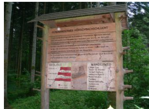
Schautafel am Beginn des Rundwanderwegs Hörschbachschlucht

Der Hörschbach mündet im westlichen Stadtteil von Murrhardt in die Murr und erschließt in seinem Verlauf ein nahezu geschlossenes Profil im unteren Mittelkeuper. Nicht nur geologisch, sondern auch landschaftlich ist das durch einen Wanderweg erschlossene Hörschbachtal sehr reizvoll. Die Wasserfälle und Prallhänge des Hörschbachs liegen in einem artenreichen Tannen-Buchen-Wald. Auf den Steilhängen der Schlucht kann sich die Vegetation in einem Schonwald von 25 ha Fläche ungestört entwickeln. Das Naturschutzgebiet Hörschbachschlucht umfasst 46 ha.