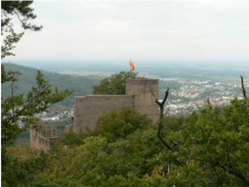
Blick von der Ritterplatte auf die Ruine von Schloss Hohenbaden