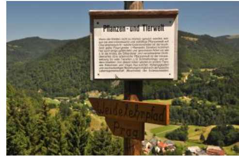
Informationstafel zur Pflanzen- und Tierwelt im Präger Gletscherkessel

Das Gebiet um den Präger Gletscherkessel ist seit 1994 Naturschutzgebiet. Es ist nach dem direkt angrenzenden Naturschutzgebiet Feldberg das zweitgrößte in Baden-Württemberg. Vor allem die alten Weidfelder an den steilen Hängen enthalten zahlreiche Kleinbiotope und sind Standorte vieler seltener Pflanzen und Tiere. Auch die vielen Blockhalden und Felsen sind Rückzugsgebiete für Spezialisten in der Tier- und Pflanzenwelt.