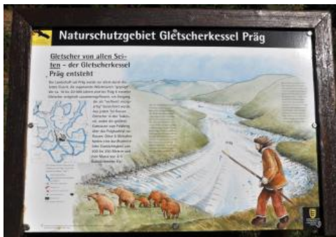
Informationstafel zum Präger Gletscherkessel

Die einzigartige Landschaft des Präger Kessels im Südschwarzwald ist während der letzten Eiszeit entstanden, als im Präger Tal aus verschiedenen Richtungen mehrere Gletscher zusammenflossen. Das Eis konnte nicht ins Tal der Wiese abfließen, da dieses bereits durch den großen Wiesetalgletscher blockiert war. So kam es bei Präg zur Zeit der Maximalvereisung zum Aufstau einer ca. 350 m dicken Eismasse bis in 1060 m Höhe (Schreiner & Sawatzki, 2000).