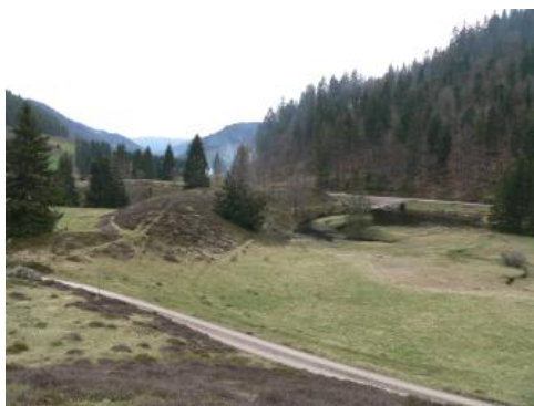
Endmoränenwälle bei der Menzenschwander Kluse

Rund um St. Blasien-Menzenschwand können mehrere Glazialformen angetroffen werden, die vom Feldberg, dem Herzogenhorn und dem Spießhorn ausgehende Gletscherzungen während der letzten Eiszeit (Würm) geschaffen haben. Es handelt sich um Endmoränenwälle, ein Hängetal mit Wasserfallstufe, das Scheibenlechtenmoos-Kar und mehrere Rundhöcker. Im mittleren, leicht vermoorten Talbereich der Menzenschwander Alb befinden sich im Bereich der „Kluse“ drei deutlich erkennbare Endmoränenwälle, die bogenförmig quer zum Tal verlaufen. Ihr Verlauf ist allerdings etwas asymmetrisch. An der Nordseite legen sich die Wälle flach an den Talrand, während sie an der Südseite senkrecht an den Rand stoßen. Die drei Moränen in der Kluse werden dem Feldsee-Stadium vor rund 13 000–12 000 Jahren zugeordnet.