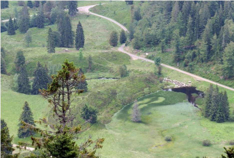
Endmoränenwälle bei der Menzenschwander Kluse