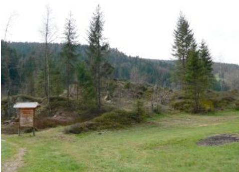
Rundhöcker bei St. Blasien-Menzenschwand

Unterhalb von Menzenschwand-Vorderdorf befinden sich beim Sportplatz einige Rundhöcker aus Bärhalde-Granit. Die typische, flach abgerundete und glatte Schlifffläche auf der Luvseite und die steilere, raue und felsige Oberfläche auf der Leeseite der Rundhöcker werden hier besonders deutlich. Diese schönen Bildungen wurden dadurch begünstigt, dass die Fließrichtung des Gletschereises mit der Hauptkluftrichtung des Granits zusammenfiel.