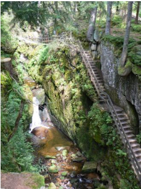
Wasserfall bei St. Blasien-Menzenschwand