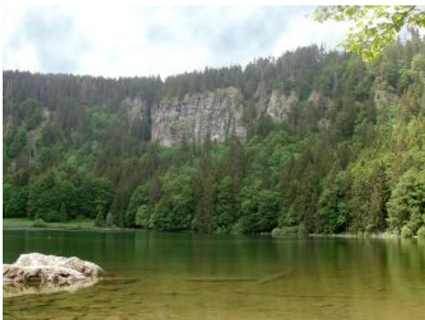
Der Feldsee mit der steilen Karwand

Das Feldseekar ist wohl das bekannteste und schönste seiner Art im südlichen Schwarzwald. Die „Lehnstuhlform“ ist mit sehr steilen felsigen Wänden typisch ausgebildet. Das Feldseekar wurde wohl bereits in der vorletzten Eiszeit (Riß) angelegt. Seine heutige Ausformung erhielt es während der letzten Eiszeit (Würm) durch den Feldberggletscher. Hinter dem Feldsee erhebt sich die beeindruckende, steile Karwand über 300 m hoch bis knapp unter den Feldberggipfel. Die Felswand besteht aus Migmatiten (durch teilweise Aufschmelzung umgewandelter Paragneis). Im oberen Teil der Wand finden sich harte Quarzporphyre. Die Karsenke ist durch die Gletschererosion stark übertieft und wird vom Feldsee eingenommen. Der See ist maximal 32,5 m tief, sehr kalt und beherbergt eine interessante Flora. Er wird im Osten von zwei Endmoränenwällen abgeriegelt. Der innere, steilgeböschte Wall wird aufgrund von Tuff-Funden im Moor zwischen